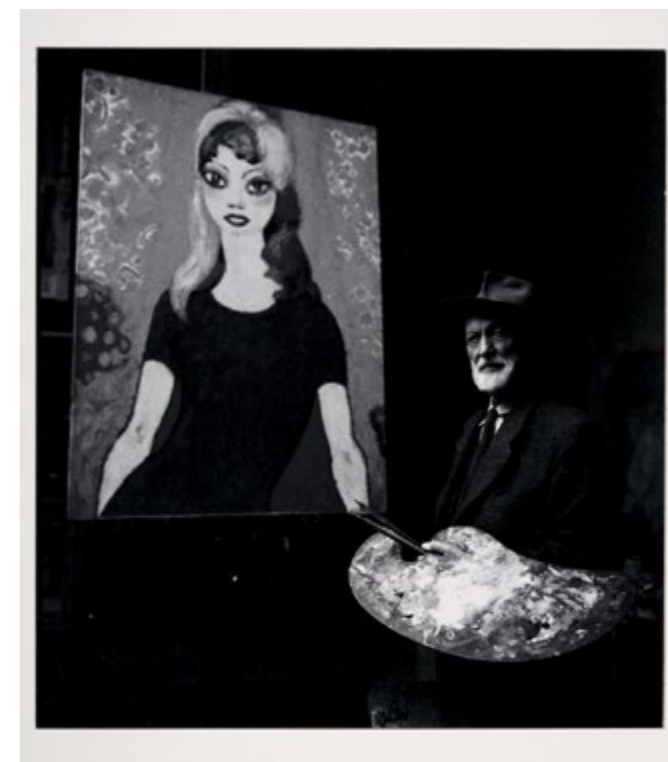
Kees Van Dongen posant devant son œuvre Brigitte Bardot de 1959 dans son atelier.

Sa réapparition constitue une véritable redécouverte, offrant aux collectionneurs l'opportunité rare d'acquérir une œuvre associant une provenance irréprochable, un sujet universellement connu et une place singulière dans l'histoire culturelle française.