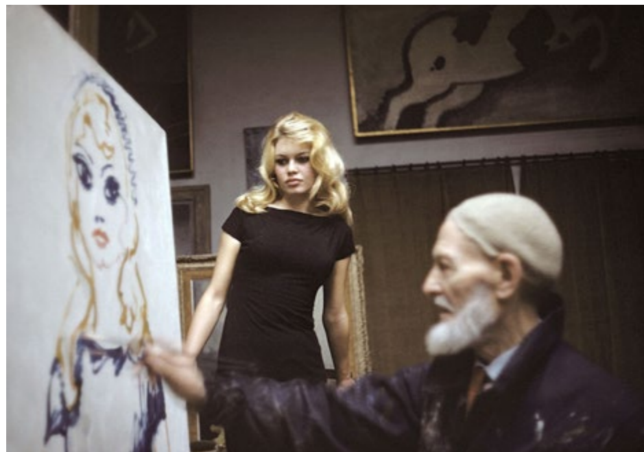
Brigitte Bardot à l'atelier de Kees Van Dongen - 12 septembre 1959

Lorsque Kees Van Dongen réalise ce portrait dans son atelier parisien du 75 rue de Courcelles, il est au sommet de sa renommée. Résident monégasque menant une vie mondaine particulièrement active, ancien fauve devenu le portraitiste privilégié de la haute société internationale, il a immortalisé les personnalités les plus en vue de son temps, d'Arletty à Maurice Chevalier en passant par Sacha Guitry.