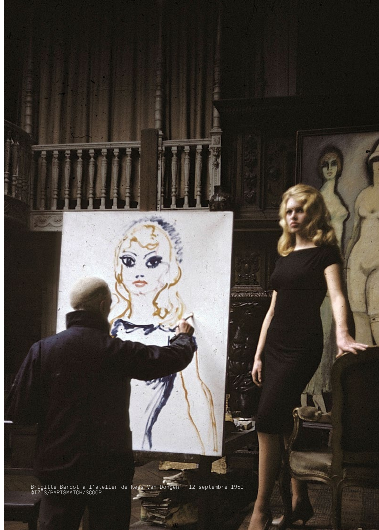
Brigitte Bardot à l'atelier de Kees Van Dongen - 12 septembre 1959