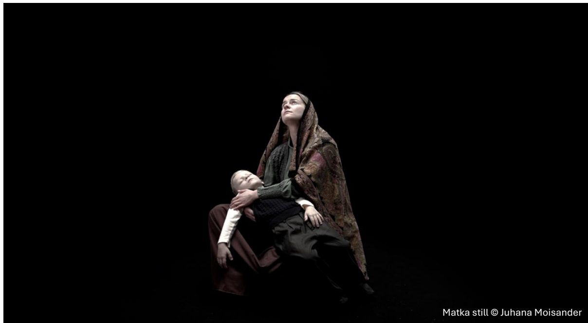
Matka still © Juhana Moisander