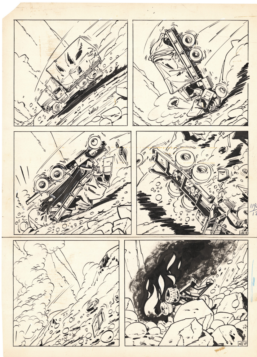
Gil Jourdan - L'enfer de Xique-Xique - Tome 5 - Pagina 41 - 1962 - Chinese inkt op papier 39 x 28 cm

Als bedenker van invloedrijke reeksen creëerde hij in de jaren 1940 onder meer Félix . Later kende hij groot succes met Gil Jourdan , een sleutelserie in het weekblad Spirou . Het album Libellule s'évade geldt als een van de meest aansprekende voorbeelden van zijn narratieve kracht. Met César en Ernestine verkende hij een lichter en humoristischer register, zonder in te boeten aan de precisie en doeltreffendheid van zijn vertelstijl.