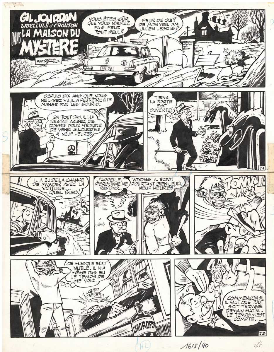
Gil Jourdan - Chaud et froid - Le grand souffle - Tome 11 - La maison du mystère - 1969 Chineuse inkt op papier - 46,5 x 36,3 cm

Galerie Huberty & Breyne Brussel presenteert van 22 mei tot en met 18 juli een erfgoedtentoonstelling gewijd aan Maurice Tillieux, zonder commercieel oogmerk. De tentoonstelling brengt een honderdtal originele werken samen uit het bezit van de familie van de kunstenaar en uit privécollecties. Zo biedt ze een zeldzame inkijk in het universum van een auteur wiens oeuvre, tegelijk eigenzinnig en baanbrekend, een belangrijke plaats inneemt in de Frans-Belgische stripgeschiedenis.