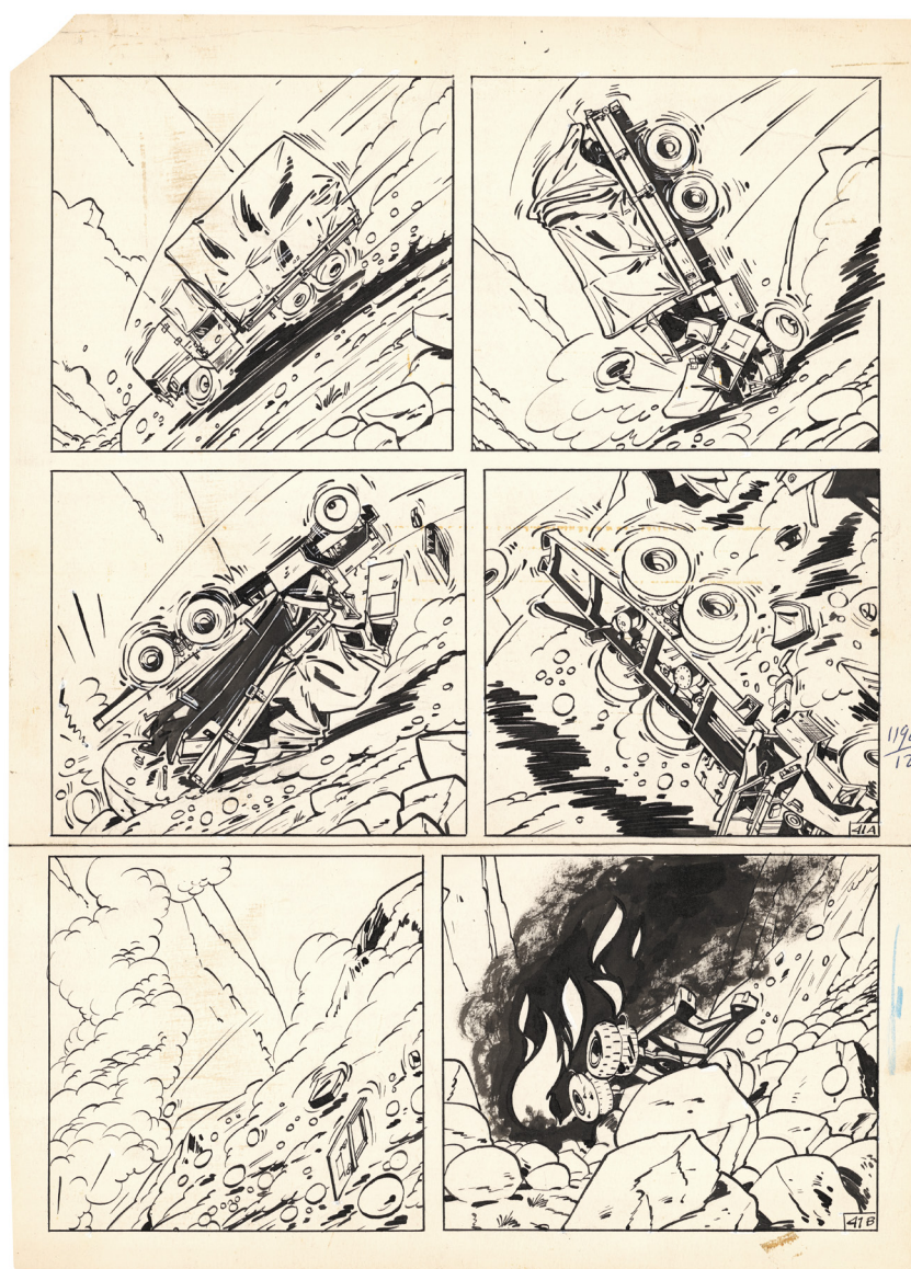
Gil Jourdan - L'enfer de Xique-Xique - Tome 5 - Planche 41 - 1962 - Encre de Chine sur papier 39 x 28 cm

Créateur de séries devenues incontournables, il donne notamment naissance à Félix dans les années 1940, avant de connaître un succès majeur avec Gil Jourdan , série phare du journal Spirou , dont l'album Libellule s'évade demeure l'un des exemples les plus emblématiques de son talent narratif. Avec César et Ernestine , il explore un registre plus léger et humoristique, tout en conservant la précision et l'efficacité de son écriture.