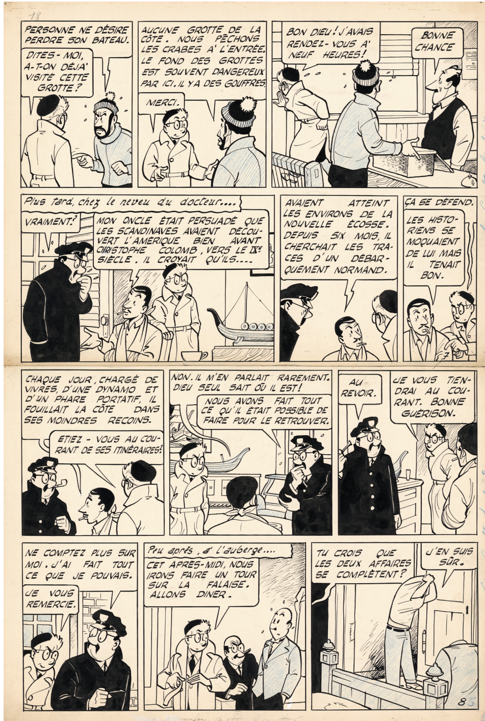
Félix - La grotte hantée - Planche 5 - 1953 - Encre de Chine et crayon bleu sur papier - 44,7 x 28,8 cm