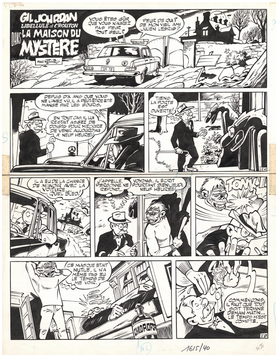
Gil Jourdan - Chaud et froid - Le grand souffle - Tome 11 - La maison du mystère - 1969 Encre de Chine sur papier - 46,5 x 36,3 cm

La galerie Huberty & Breyne, espace Bruxelles | Châtelain, présente, du 22 mai au 18 juillet, une exposition patrimoniale - à caractère non marchand - dédiée à Maurice Tillieux, réunissant une centaine d'œuvres originales provenant de la famille de l'artiste et de collections privées. Cet ensemble exceptionnel offre une plongée rare dans l'univers d'un auteur dont l'œuvre, à la fois singulière et fondatrice, occupe une place essentielle dans l'histoire de la bande dessinée franco-belge.