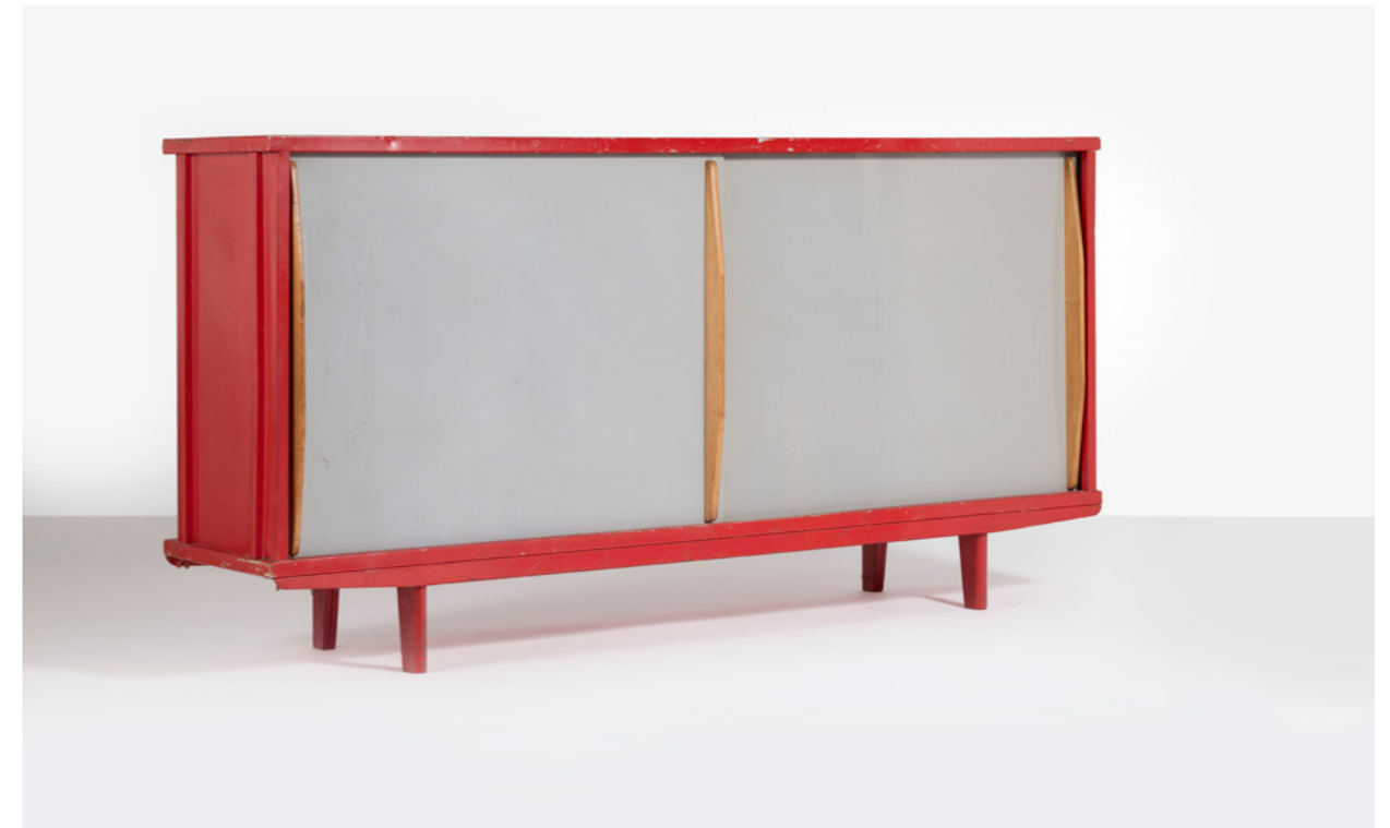
Jean PROUVÉ (1901-1984) Bahut «tout aluminium n. 151» Estimation : 60 000 - 80 000 €