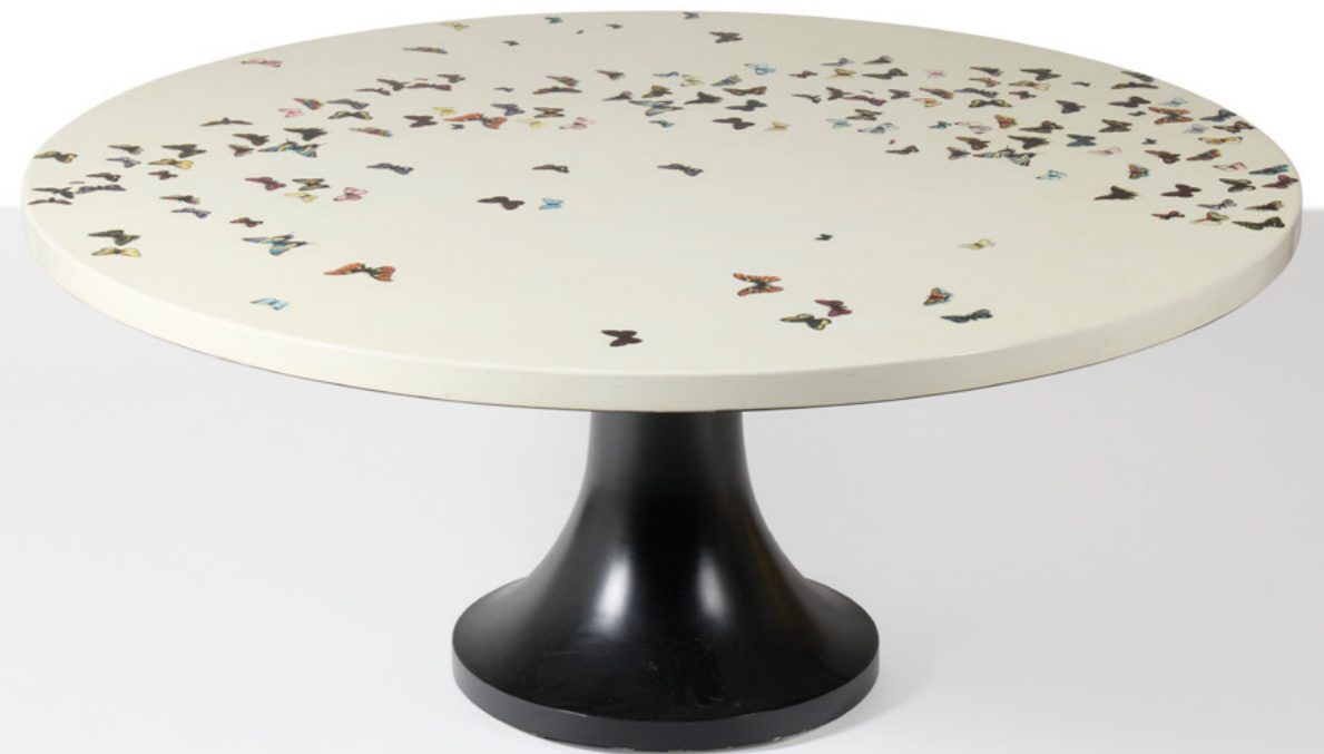
Piero FORNASETTI (1913-1988) Table de salle à manger Pièce unique à structure en bois laqué noir, plateau à décor lithographié d'une nuée de papillons Signé du cachet «FORNASETTI MILANO / MADE IN ITALY» 75 x 170 cm Estimation : 8 000 - 10 000 €