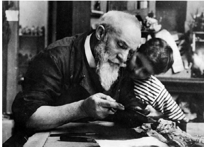
Victor Prouvé et son fils Jean - circa 1910