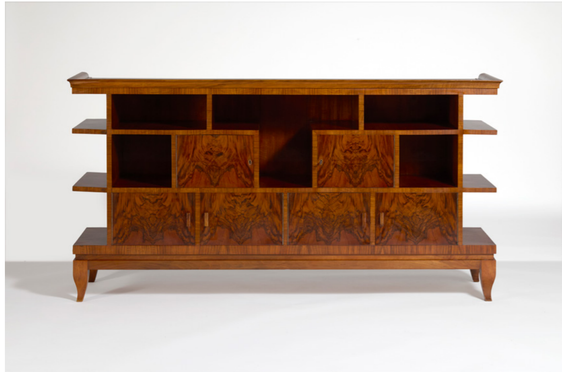
Gio PONTI (1891-1979) Bibliothèque - circa 1930 Structure en noyer et placage en loupe de noyer national Edition Domus Nova 97 x 183,5 x 44 cm Estimation : 10 000 - 12 000 €

Cette seconde vente célébrera l'excellence du design italien à travers 100 pièces iconiques, à l'occasion du centenaire de l'Exposition internationale des arts décoratifs de 1925. Cet événement rend hommage au savoir-faire artisanal italien, avec une attention particulière portée au verre, matériau aussi fascinant qu'innovant, qui a profondément marqué l'histoire du design.