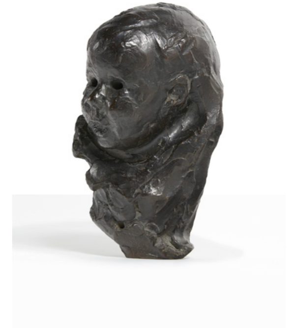
Victor PROUVÉ (1858-1943) Visage probablement de Jean Prouvé Epreuve en bronze Estimation : 1 000 - 1 200 €