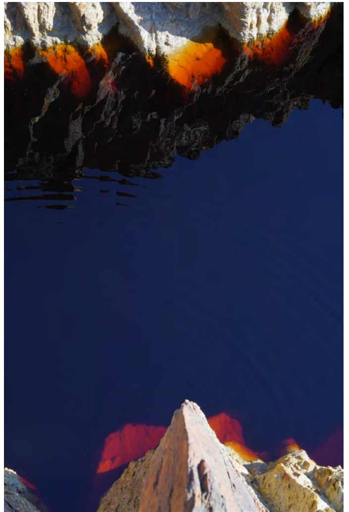
Rio Tinto_09618, transparante film, 2024.

compositie, aangezien de formaten en dragers variëren, afhankelijk van het thema dat aangekaart wordt. Hij fotografeert Marée noire [Olievlek] dat de ramp met gezonken olietankers vastlegt, Erika (1999) en Prestige (2002) op de Franse, Spaanse en Portugese kust en Marée verte [Groene vlek] over de invasie van algen als gevolg van intensieve teeltpraktijken. Deze twee reeksen benadrukken de fascinerende formele schoonheid van deze fenomenen, maar onthullen tegelijkertijd hun vernietigende impact op de fauna en flora.