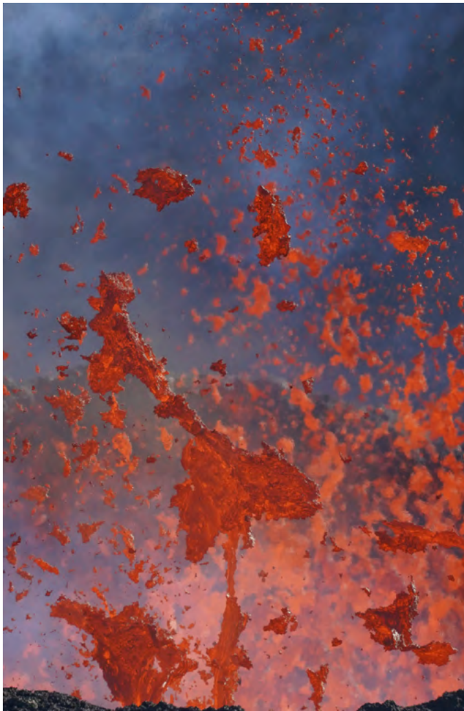
Fagradalsfjall_3006, inkjetafdruk, 2022.