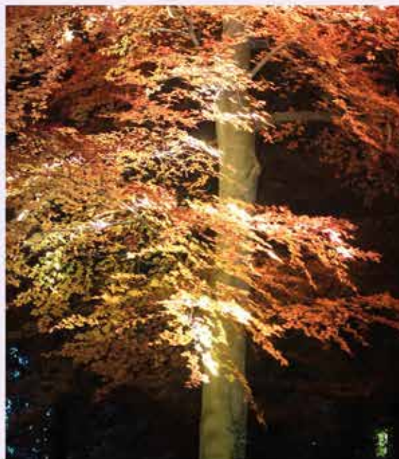
©All the Trees, Studio Lemerrier (Juliette Bibasse et Joanie Lemerrier)

Au cœur du jardin de la Maison Losseau, "All the Trees" révèle la respiration lumineuse des arbres. Chaque branche s'illumine comme traversée par une énergie silencieuse, offrant un spectacle à la fois technologique et contemplatif. Pensée pour Mons, l'installation met en valeur la flore locale et souligne la nécessité de préserver le vivant. Autonome en énergie et peu consommatrice, elle incarne une création responsable où art et écologie se rejoignent dans une même poésie.