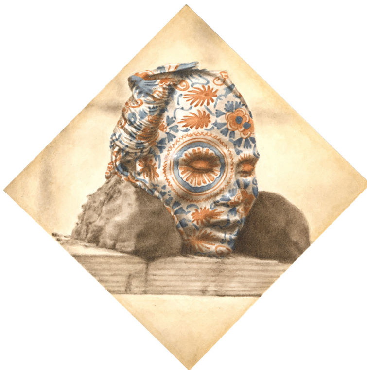
Milan Jaspers - Gôkumon - 2024 - Aquarelle sur papier - 14,6 x 14,6 cm - Signé au dos

Milan Jaspers élabore ses images dans un équilibre subtil entre révélation et restitution, partagé entre le regard d'un dessinateur et celui d'un peintre. Usant d'une palette à l'aquarelle fidèle aux teintes traditionnelles sépia des premières photographies, il intègre des motifs colorés qui évoquent chromatiquement notre modernité. Travail de précision et de patience, l'artisanat du pinceau répond à ce procédé révolutionnaire et rapide de la photographie qui sert ici de modèle, la peinture répondant à la nécessité contemporaine de « prendre le temps ».