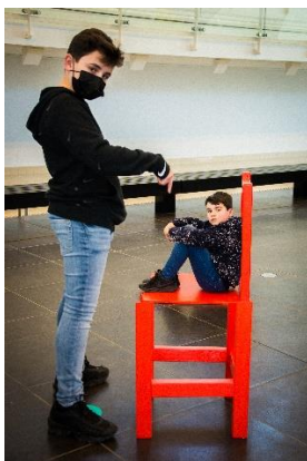
Foto van de tentoonstelling Illusies in La Cité Miroir in 2021

Nieuwigheid (onder andere) van deze editie: "De put zonder bodem" is een optische illusie die gebaseerd is op een visueel effect dat een gevoel van oneindige diepte creëert. Het werkt