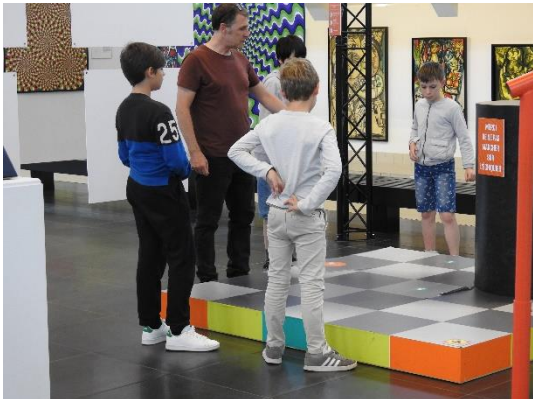
Foto van de tentoonstelling Illusies in La Cité Miroir in 2021

Deze laatste fase is volledig ingebed in een systeem van laïciteit, bedoeld om kritisch denken, nuance, debat en respect voor standpunten te bevorderen, binnen de context van samenleven en een meer rechtvaardige en humanistische samenleving. Het Centre d'Action Laïque van de provincie Luik wil hierbij ook een synthese en aangenaam hulpmiddel aanbieden aan zowel burgers als de educatieve sector om de thema's van de tentoonstelling in groepsverband aan te pakken.