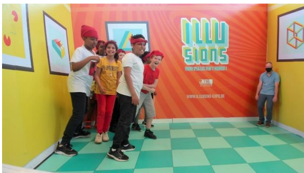
Foto van de tentoonstelling Illusies in La Cité Miroir in 2021