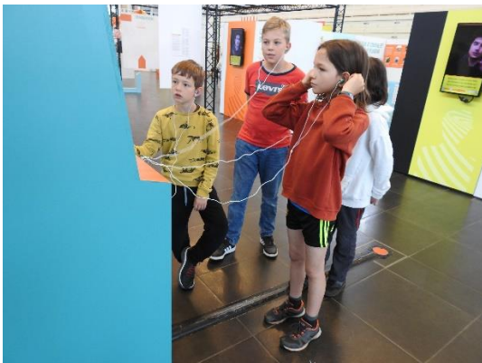
Foto van de tentoonstelling Illusies in La Cité Miroir in 2021