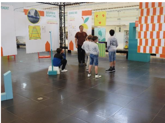
Foto van de tentoonstelling Illusies in La Cité Miroir in 2021