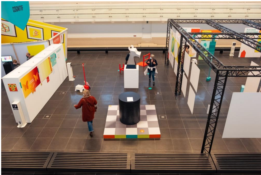
Foto van de tentoonstelling Illusies in La Cité Miroir in 2021