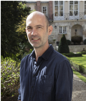
Nicolas de Crécy

En 1991, il publie l'album Foligatto aux Humanoïdes Associés, qui remporte de nombreux prix. Le Bibendum céleste , une de ses œuvres majeures, paraît en 1994. Il obtient l'Alph-Art du meilleur album en 1997 pour Léon la Came , trilogie composée avec Sylvain Chomet chez Casterman. Suivent une quarantaine de livres, explorant diverses pistes: illustration, carnets de voyage, textes personnels. Il sera le premier auteur de la collection de bande dessinée initiée par le musée du Louvre, en 2005, avec Période Glaciaire . Il sera également un des rares auteurs à être publié directement au Japon avec La République du catch , éditée par Shueisha Publishing et parue dans le mensuel Ultrajump en 2014.