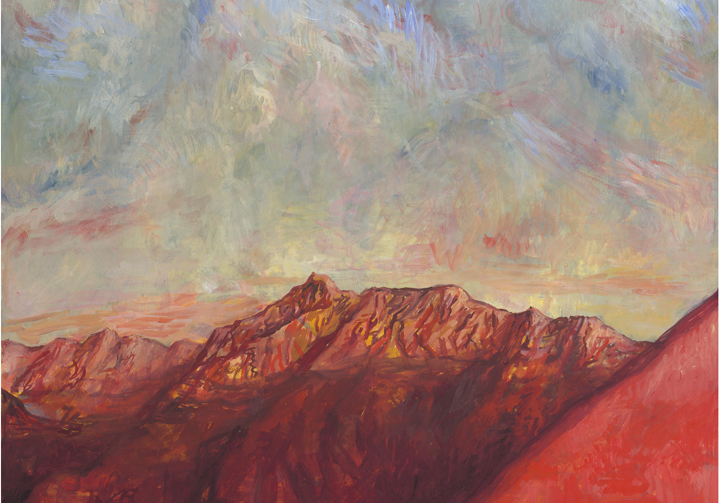
Nicolas de CRÉCY - Aiguilles rouges (détail) - 50 x 65 cm - Gouache sur papier Vergé - 2023