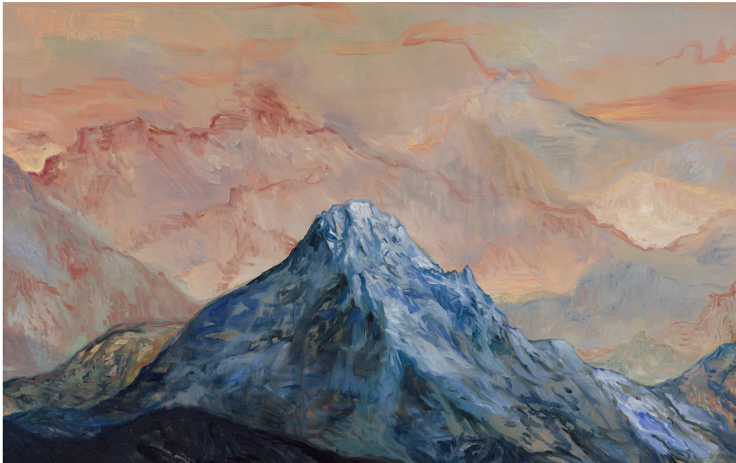
Nicolas de CRÉCY - L'Aiguille Bleue - 70 x 44 cm - Huile sur bois - 2024