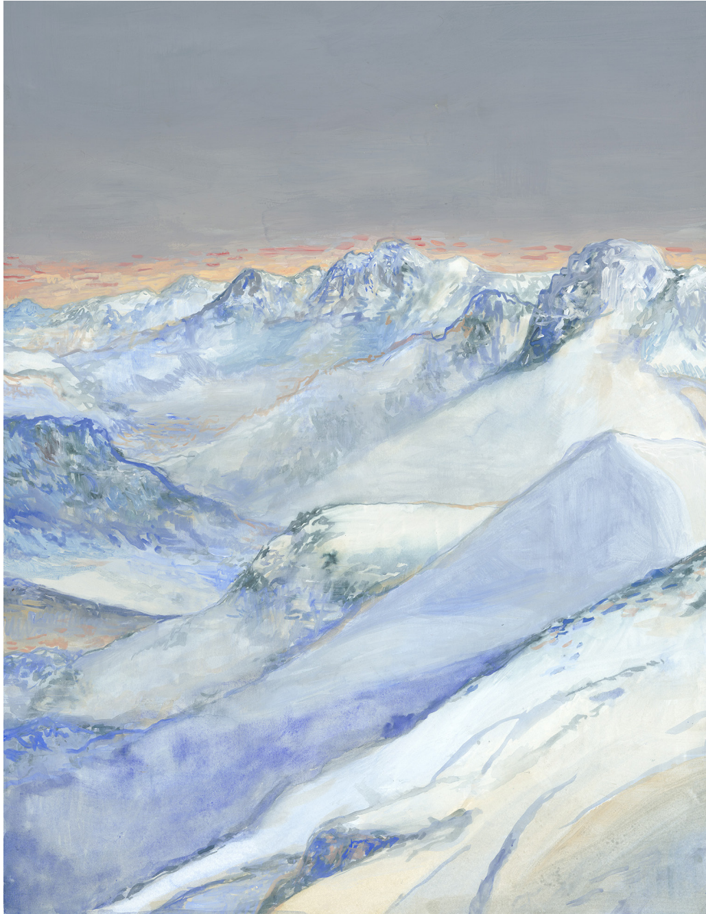
Nicolas de CRÉCY - Neige - 50 x 65 cm - Aquarelle et gouache sur papier Vergé - 2023