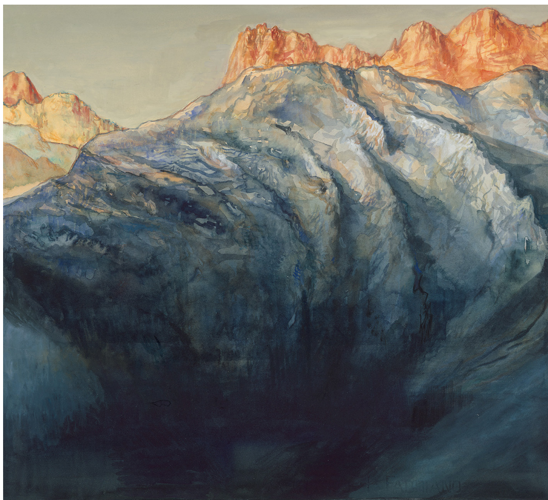
Nicolas de CRÉCY - Combe noire - 52 x 47 cm - Aquarelle et gouache sur papier - 2023

S'inspirant de sa propre expérience de la montagne, il retranscrit cette atmosphère particulière à travers près de septante œuvres aux techniques variées: peinture, collage, gravure, fusain, aquarelle, etc.