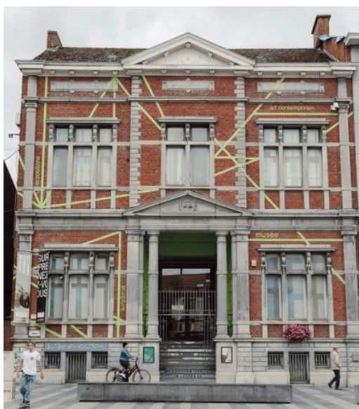
Het Mill – Musée Ianchelevici La Louvière