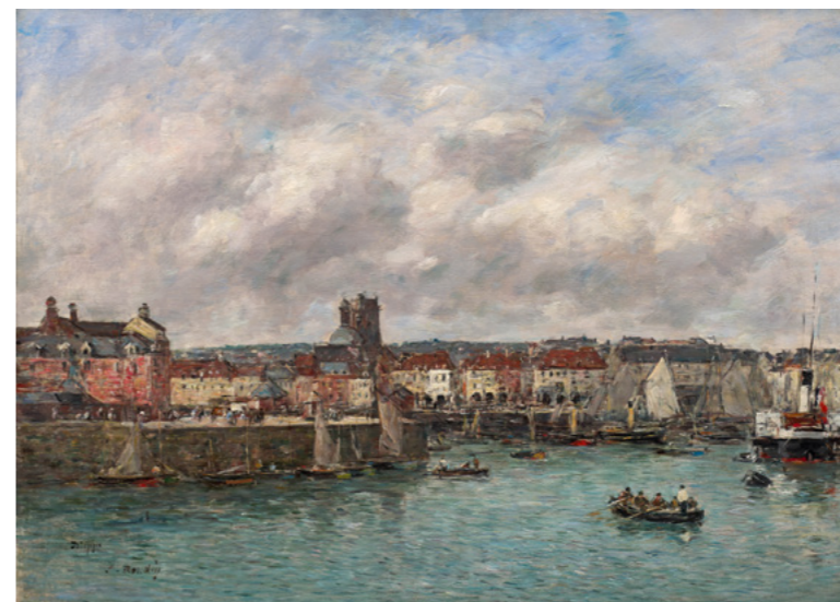
Eugène BOUDIN Dieppe. Le port, vue prise du Pollet Vendu : 124 640 € / 129 201 $ frais inclus