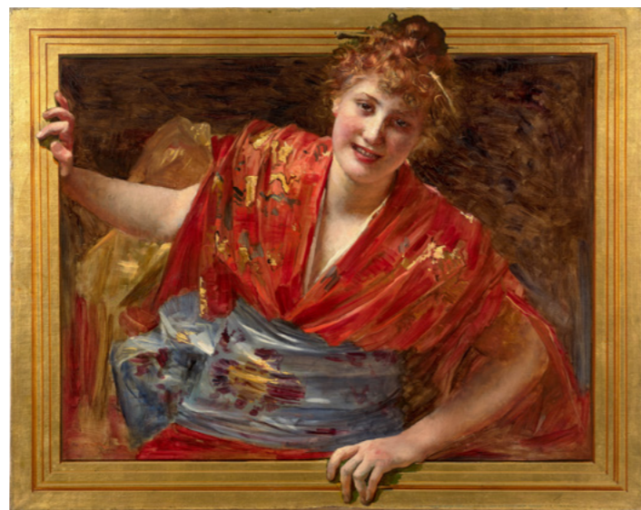
Paul ANDREZ, pseudonyme de Vlaho BUKOVAC La belle au kimono, trompe-l'oeil Vendu : 78 720 € / 81 601 $ frais inclus