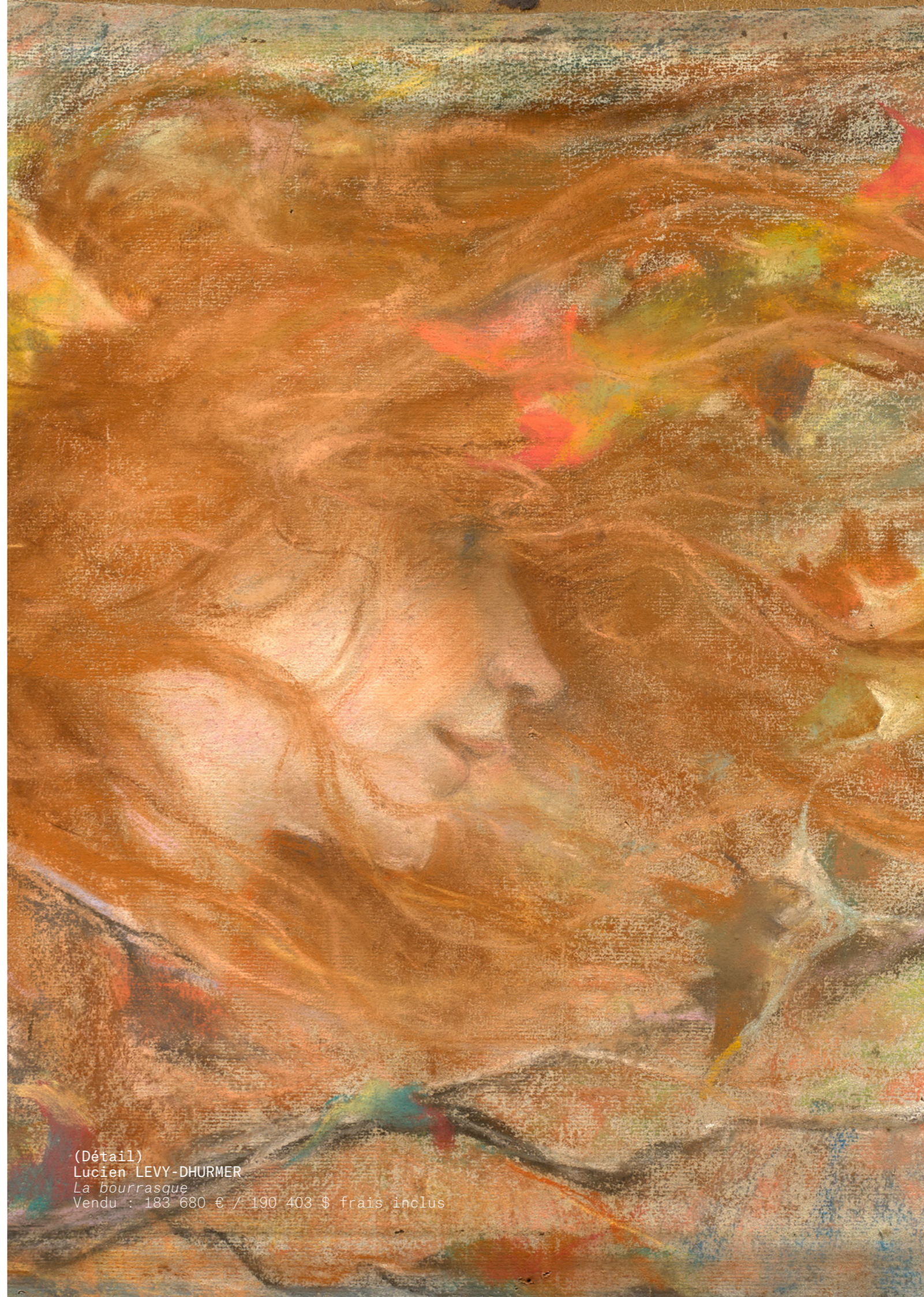
(Détail) Lucien LEVY-DHURMER La bourrasque Vendu : 183 680 € / 190 403 $ frais inclus