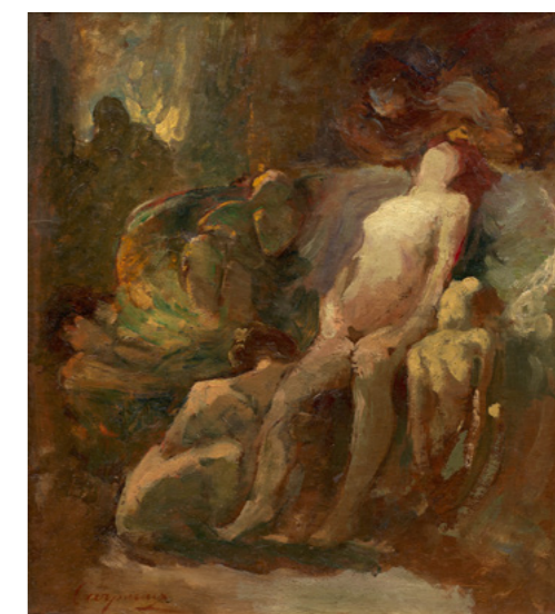
Jean-Baptiste CARPEAUX L'accouchement (femme nue assise) Vendu : 45 920 € / 47 600 $ frais inclus