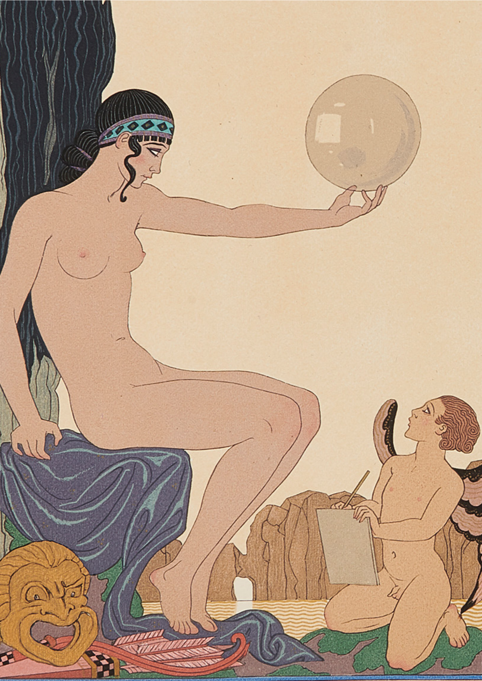
[BARBIER] Marcel SCHWOB Vies imaginaires Paris, 1929 Estimation : 4 000 - 6 000 €