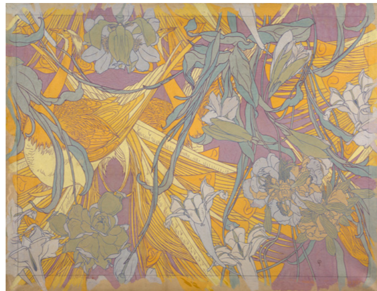
Georges de FEURE (1868-1943) Le Faisan Tempera sur papier, marouflé sur toile 54 x 81 cm Estimation : 30 000 - 40 000 €