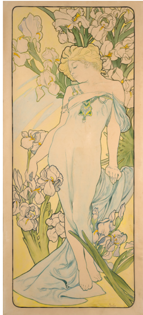
Alphonse MUCHA (1860-1939) L'Iris Aquarelle gouachée sur traits de crayon sur papier tendu sur carton 113,5 x 51 cm Estimation : 40 000 - 60 000 €