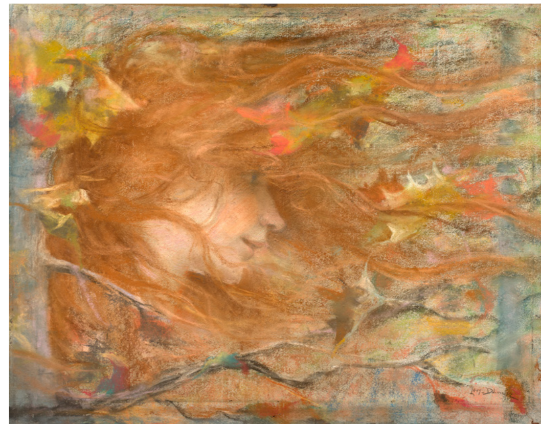
Lucien LEVY-DHURMER (1865-1953) La bourrasque Pastel sur papier vergé, marouflé sur carton 41 x 50 cm Estimation : 60 000 - 80 000 €