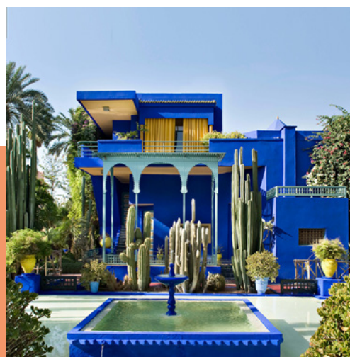
Le Jardin Majorelle