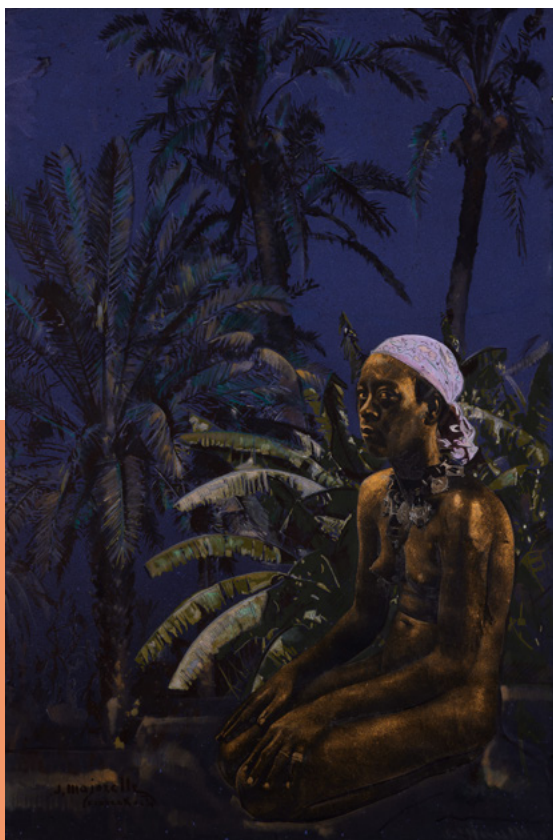
Jacques MAJORELLE (1886 - 1962) Bijoux berbères - circa 1933 - 1934 Détrempé sur papier à réhauts de poudres métalliques or et argent 106 x 71 cm Estimation : 250 000 - 350 000 € 2 750 000 - 3 850 000 MAD

Conservée depuis plus de 80 ans dans la même famille, l'œuvre est estimée 250 000 - 350 000 €.