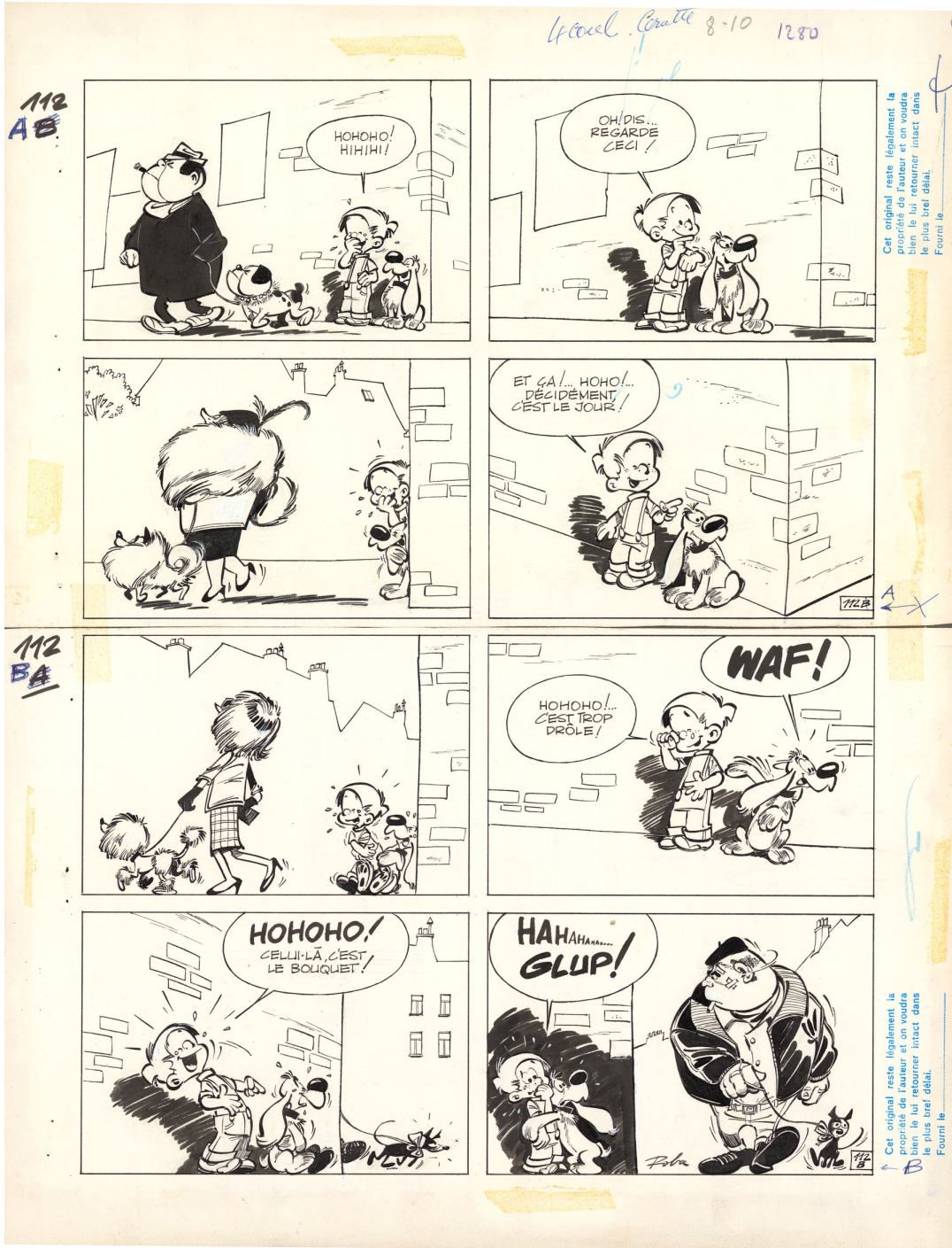
60 Gags van Bollie en Billie, Tome 2, 1964, Pagina 54, Chinese inkt op papier. 39 x 28 cm.