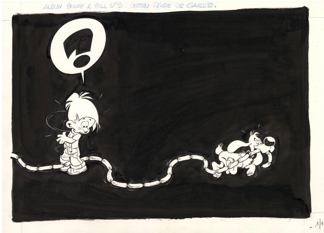
60 Gags van Bollie en Billie , Tome 5, 1969, Titelpagina, Chinese inkt op papier. 32,5 x 46 cm.

De kunstenaar overleed in juni 2006, op 75-jarige leeftijd.