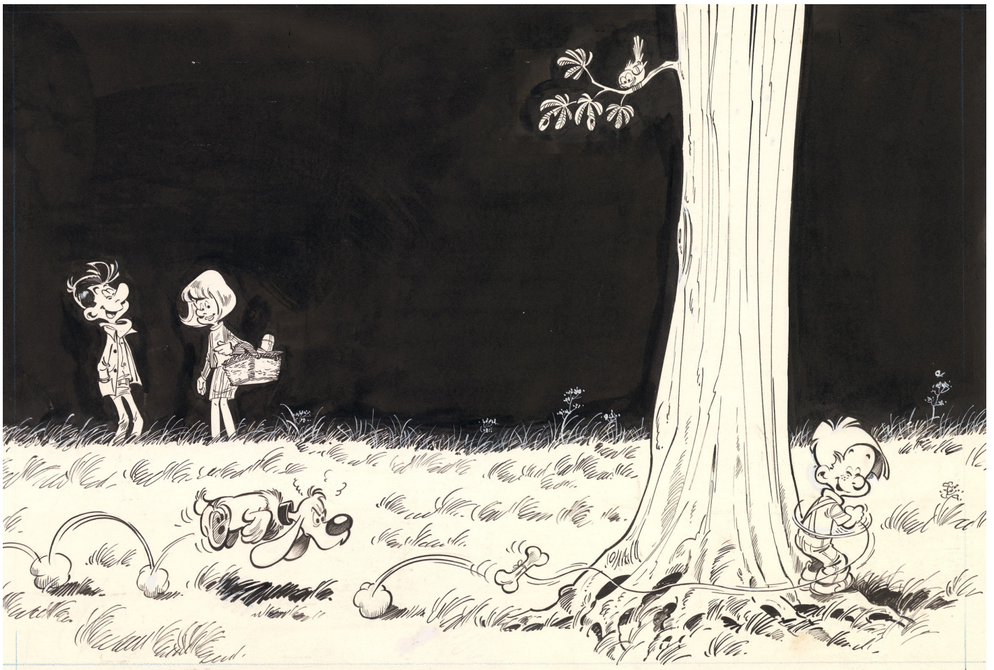
60 Gags van Bollie en Billie, Tome 4, 1967, Titelpagina, Chinese inkt op papier. 30 x 45,5 cm.