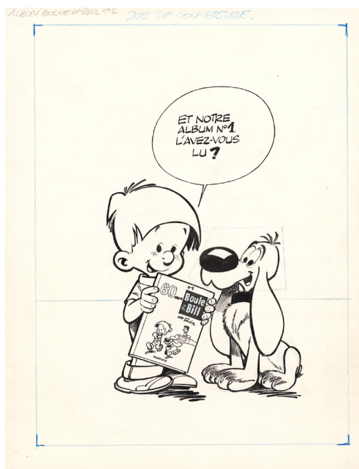
60 Gags van Bollie en Billie , Tome 2, 1964, Achterkant, Chinese inkt op papier. 29 x 21,5 cm.

Sinds zijn vertrek in 2006 worden zijn 1.149 originele platen beschermd in de fondation Jean Roba, in overeenstemming met zijn wensen. Zijn werk, vol humor en eenvoud, is een ware schatkamer van het Belgische stripverhaal en wordt dankzij deze gratis tentoonstelling teruggegeven aan het publiek. Het is een unieke kans om deze beroemde personages te herontdekken die zoveel kinderen in slaap hebben gesust.