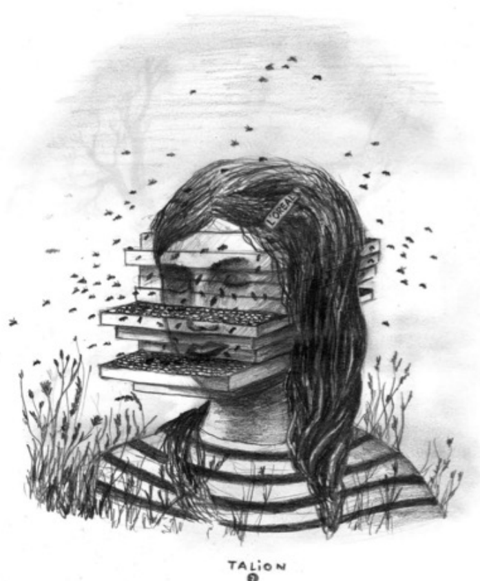
Talion. 3, algraphie, 360x 60, 2018-2021