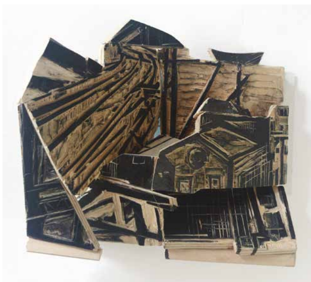
Onderdak , collage de plaques gravées sur bois, 200x220, 2023 © Hanna De Haan