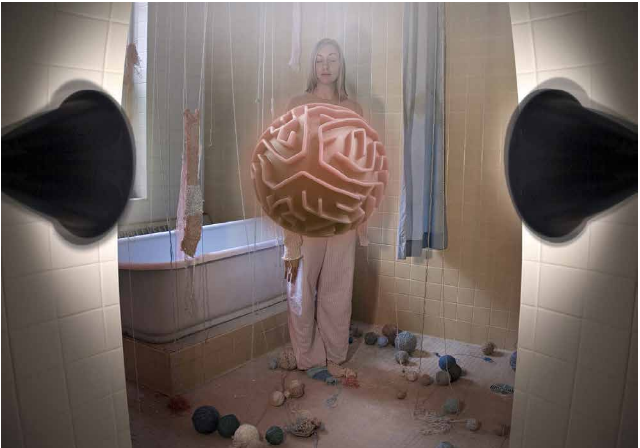
Feedback Loop, impression digitale, 610x864, 2022 © Davida Kidd

Het programma en praktische informatie kunt u vinden op de website: https://www.laboverie.com