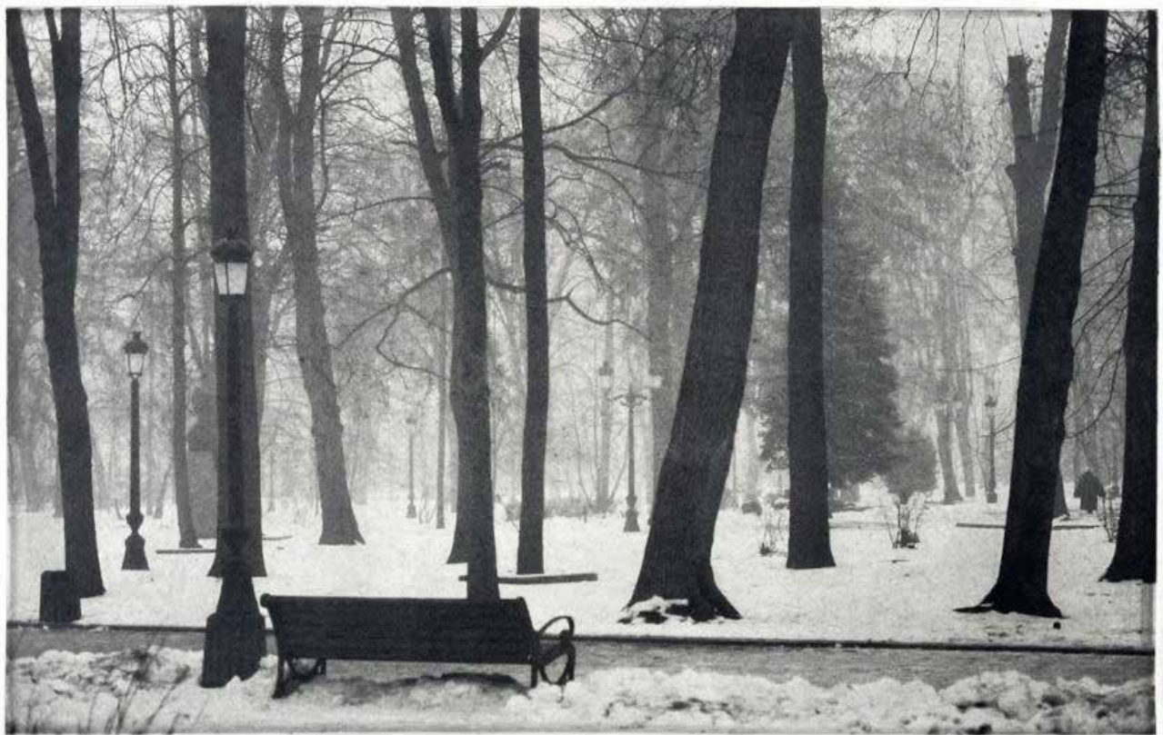
Kyiv, photopolymère, 285x300, Février 2022 - 2023