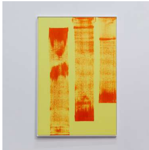
Links: Alain Séchas, Maryline 4 , 2024. Acryl op doek. Courtesy van de kunstenaar en Galerie Laurent Godin, Paris.