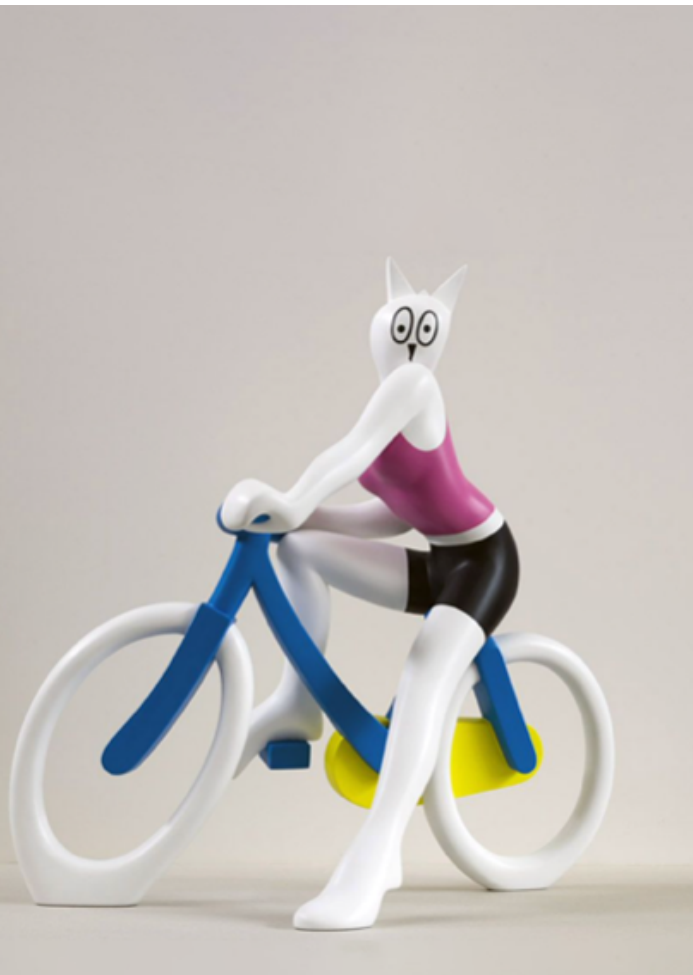
Alain Séchas, La Cycliste édition , polyurethaan en acryl, 2006

De tentoonstelling heeft als titel Ik verveel me nooit... , een uitdrukking die verwijst naar de grote productie van de kunstenaar. Ze had echter evengoed Verandering van methode kunnen heten, aangezien Séchas duidelijk plezier beleeft aan het experimenteren met verschillende technische registers. In recente, nog niet getoond series zoals Maryline of Monaco , worden emblematische werken uit verschillende periodes opgenomen, zodat we oude werken vanuit een nieuw perspectief kunnen bekijken en de onderliggende eenheid van een schijnbaar veelzijdige praktijk met de tekening als drijfveer kunnen begrijpen.