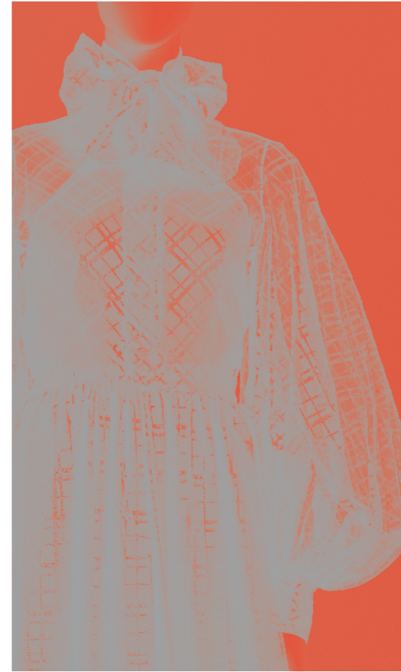
9. Lanvin haute couture, lente-zomer 1973, avondjurk ‘Express’ in geruite zwarte organzazijde met kleine witte kraag.