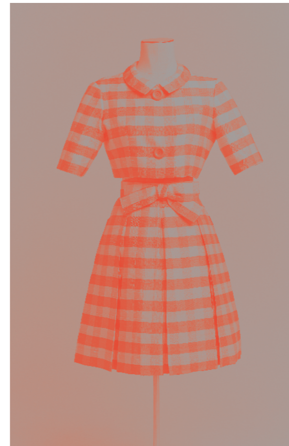
3. Nina Ricci haute couture, lente-zomer 1960, ensemble van bolero, jurk en ceintuur met geribbelde strik uit wilde zijde.

65 silhouetten, vergezeld van schetsen, foto's, films en archiefstukken, brengen de figuur en het werk van de eertijds beroemde, maar nu in de vergetelheid geraakte couturier weer tot leven. Er staat je gegarandeerd een openbaring te wachten!