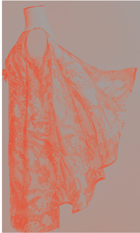
4. Model Nina Ricci haute couture, lente-zomer 1963, cocktailjurk in zijdemousseline met veelkleurige bedrukking.

rokken en brede ceinturen ter hoogte van de taille. De volgende collectie zette dit zeer vrouwelijke silhouet voort. De vernieuwing lag in het deel boven de buste, met een hoge halsuitsnijing en een terugwijkende schouderlijn die nieuwe verhoudingen creëerden. In dit emblematische model in blauw damast contrasteert de gecentreerde taille scherp met het volumineuze bovenstuk, waardoor een zeer opvallend silhouet ontstaat. Zo bereikte Crahay het schier onmogelijke: twee indrukwekkende collecties na elkaar!