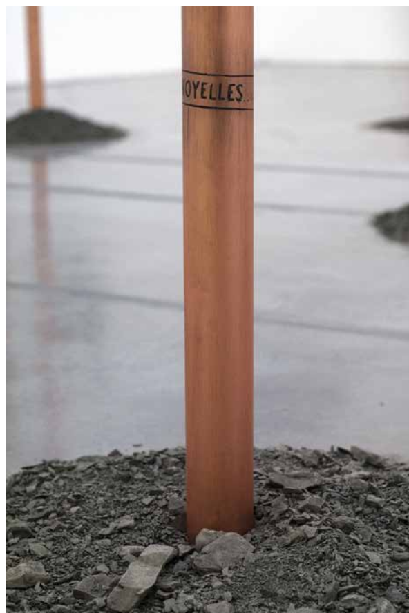
Forage mémoriel