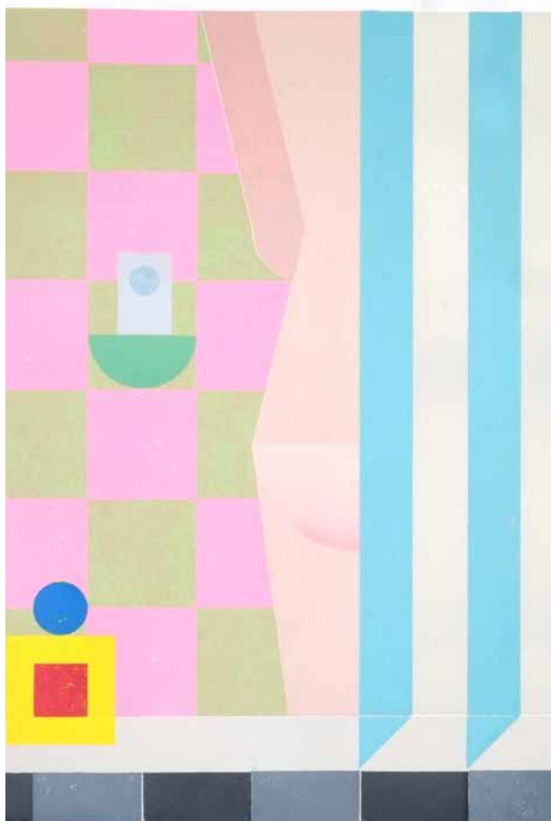
Aufstellung At Home (Bad), impression en relief, 640x470, 2023 © Badock

Inscription obligatoire (max 15 pers par atelier) : www.laboverie.com/billetterie