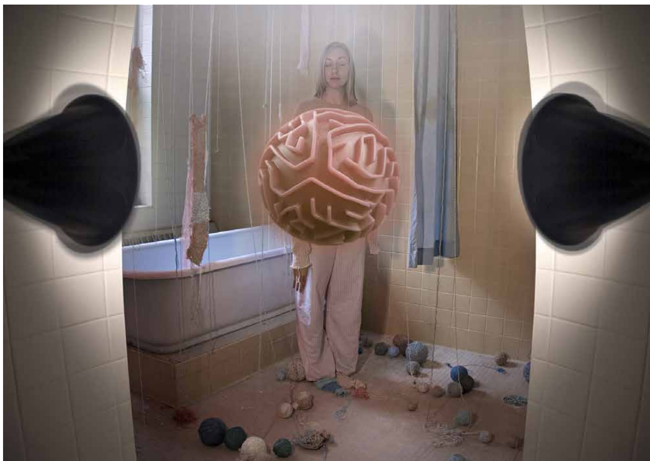
Feedback Loop , impression digitale, 610x864, 2022 © Davida Kidd

Le programme et les informations pratiques sont à retrouver sur le site internet : www.laboverie.com