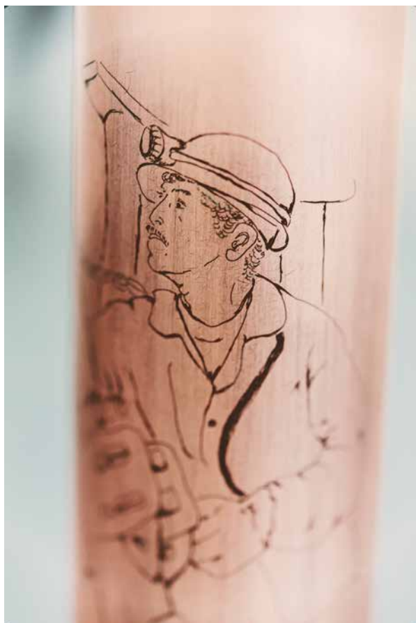
Forage mémoriel © VAN MELICK Sarah

Cette année, c'est la jeune française Sarah Van Melick qui remporte le Prix Dacos. Sa démarche artistique vise à traiter des notions d'identité et de métissage culturel. Elle tisse des liens entre différentes strates : rencontres, langages, mémoire, impressions, matières. À travers son art, elle essaye de démontrer ses questionnements sur le multiculturalisme. Elle puise dans les codes, les histoires et les archives de différentes cultures afin de faire entendre les récits alternatifs de personnes, ou même d'objets.