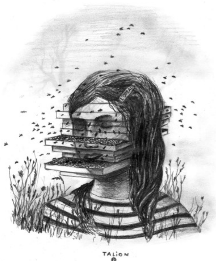
Talion, 3, algraphie, 360x 60, 2018-2021