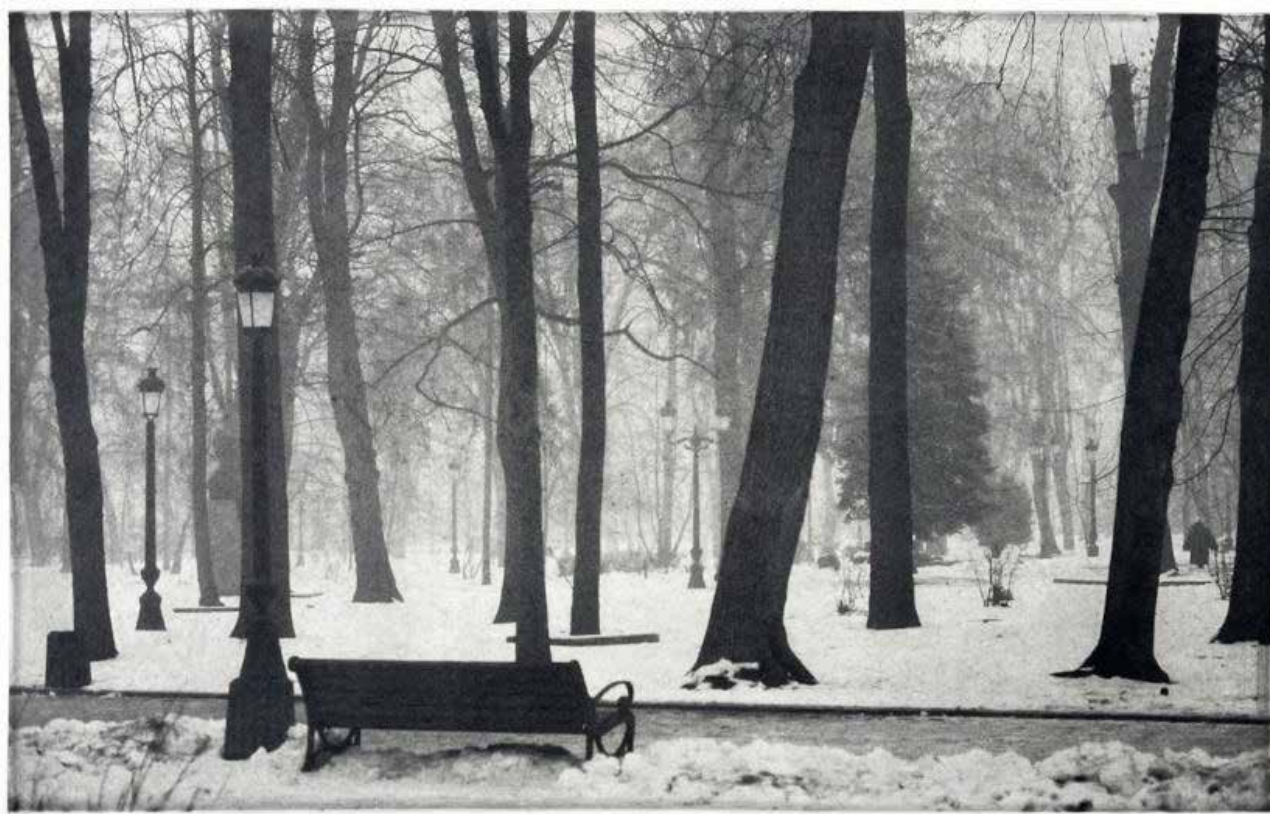
Kyiv, photopolymère, 285x300, Février 2022 - 2023