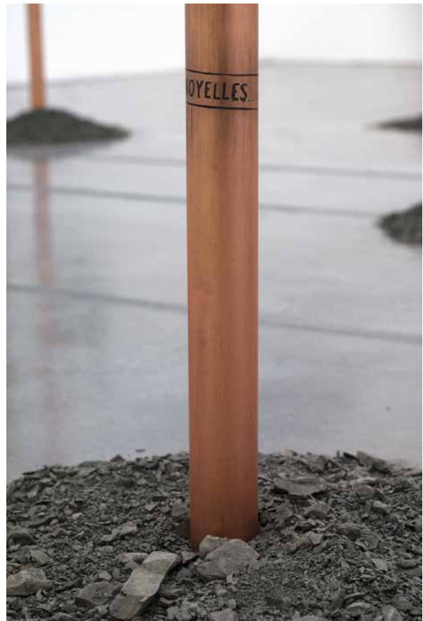
Forage mémoriel © VAN MELICK Sarah