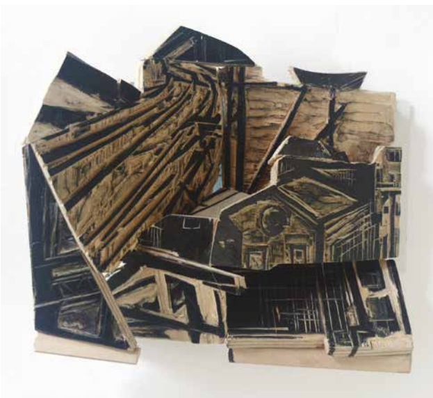
Onderdak , collage de plaques gravées sur bois, 200x220, 2023 © Hanna De Haan