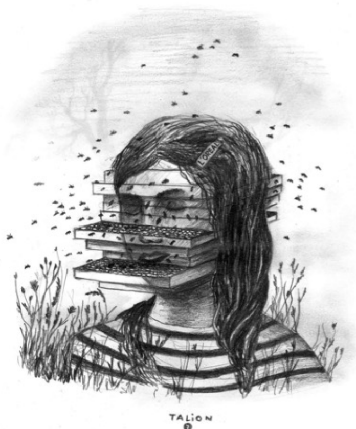
Talion, 3, algraphie, 360x 60, 2018-2021