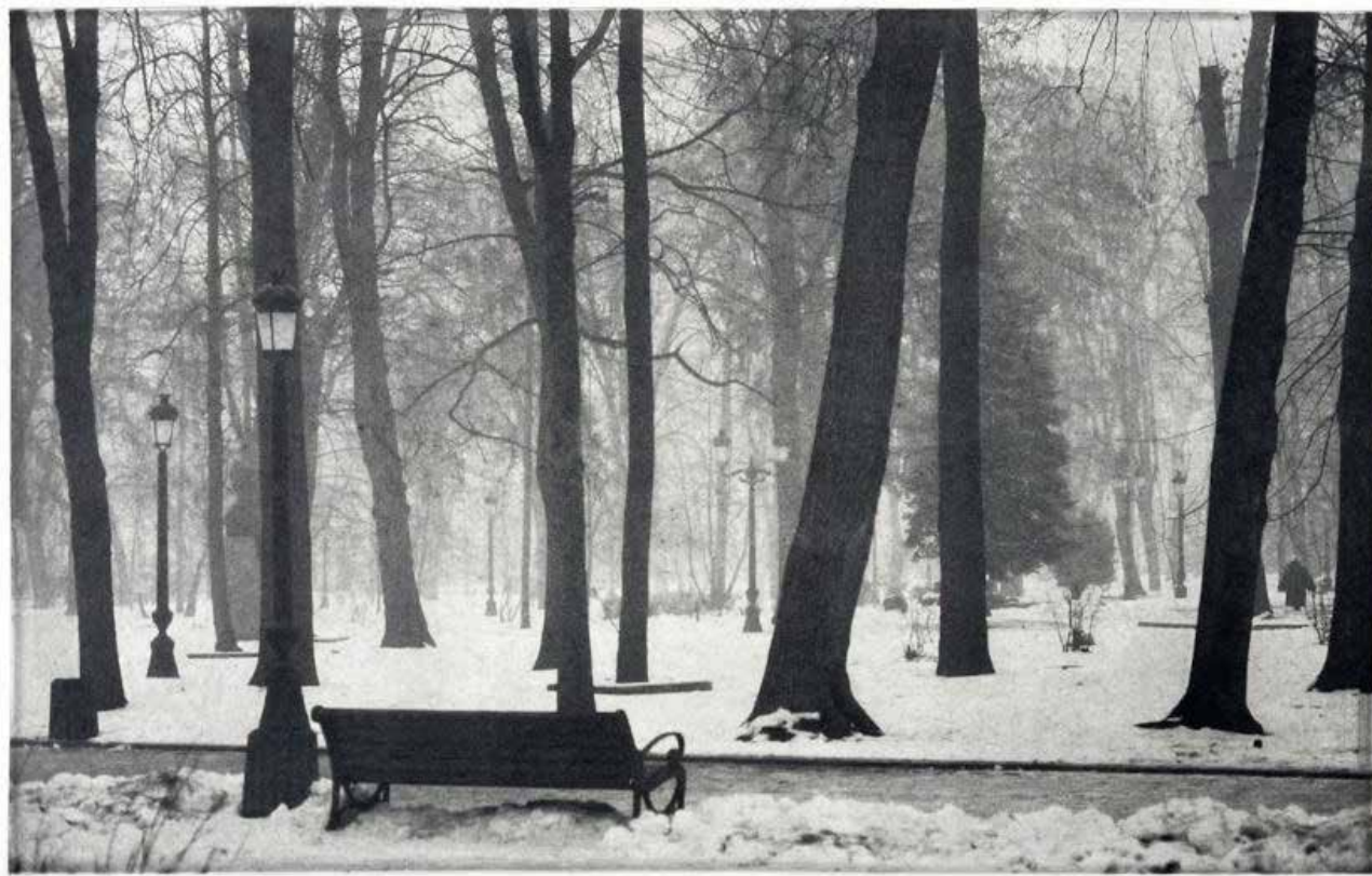
Kyiv, photopolymère, 285x300, Février 2022 - 2023