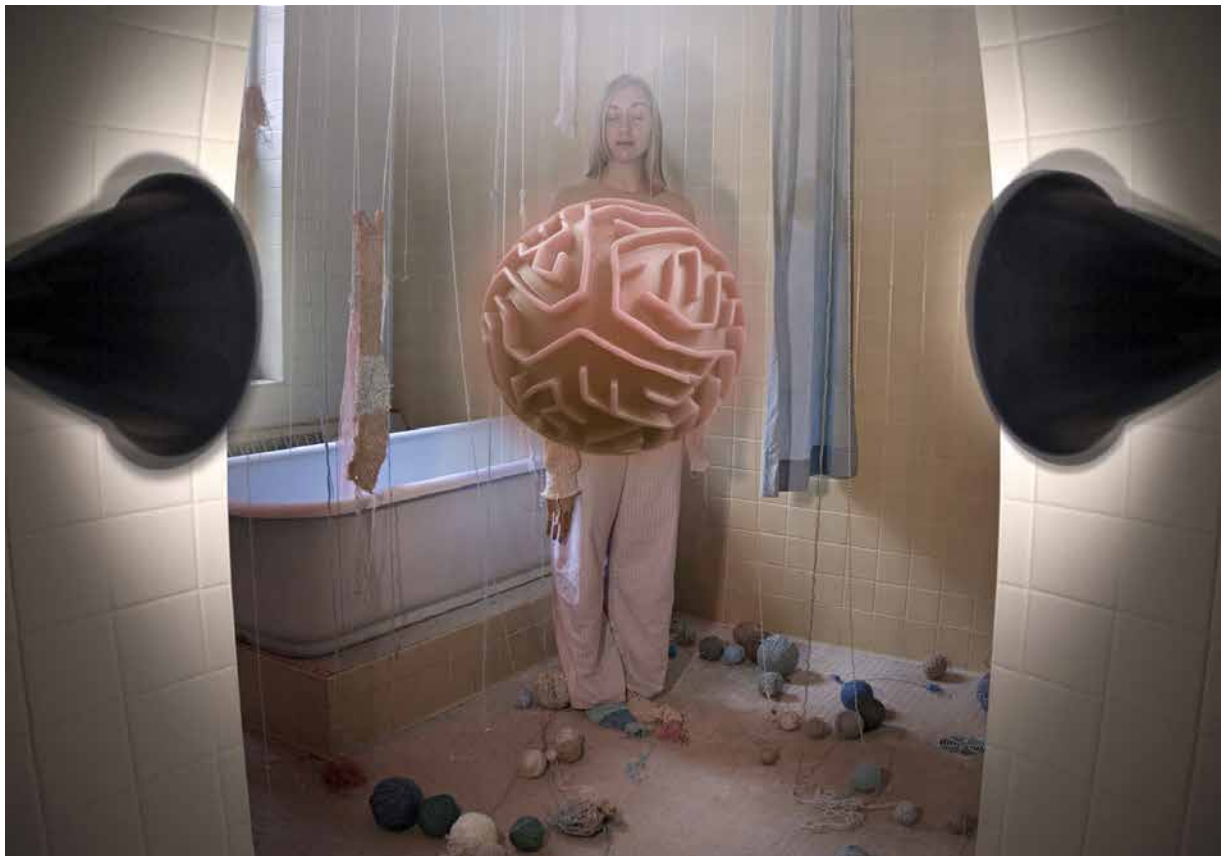
Feedback Loop , impression digitale, 610x864, 2022 © Davida Kidd