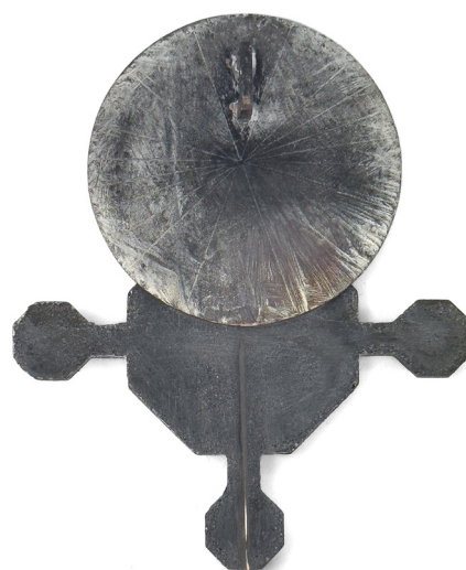
Frederic FRENAY (BE)

Ensemble, délibérément ou incidemment, ils nous initient au mystère de la création pour finalement – pourquoi pas – la démystifier.