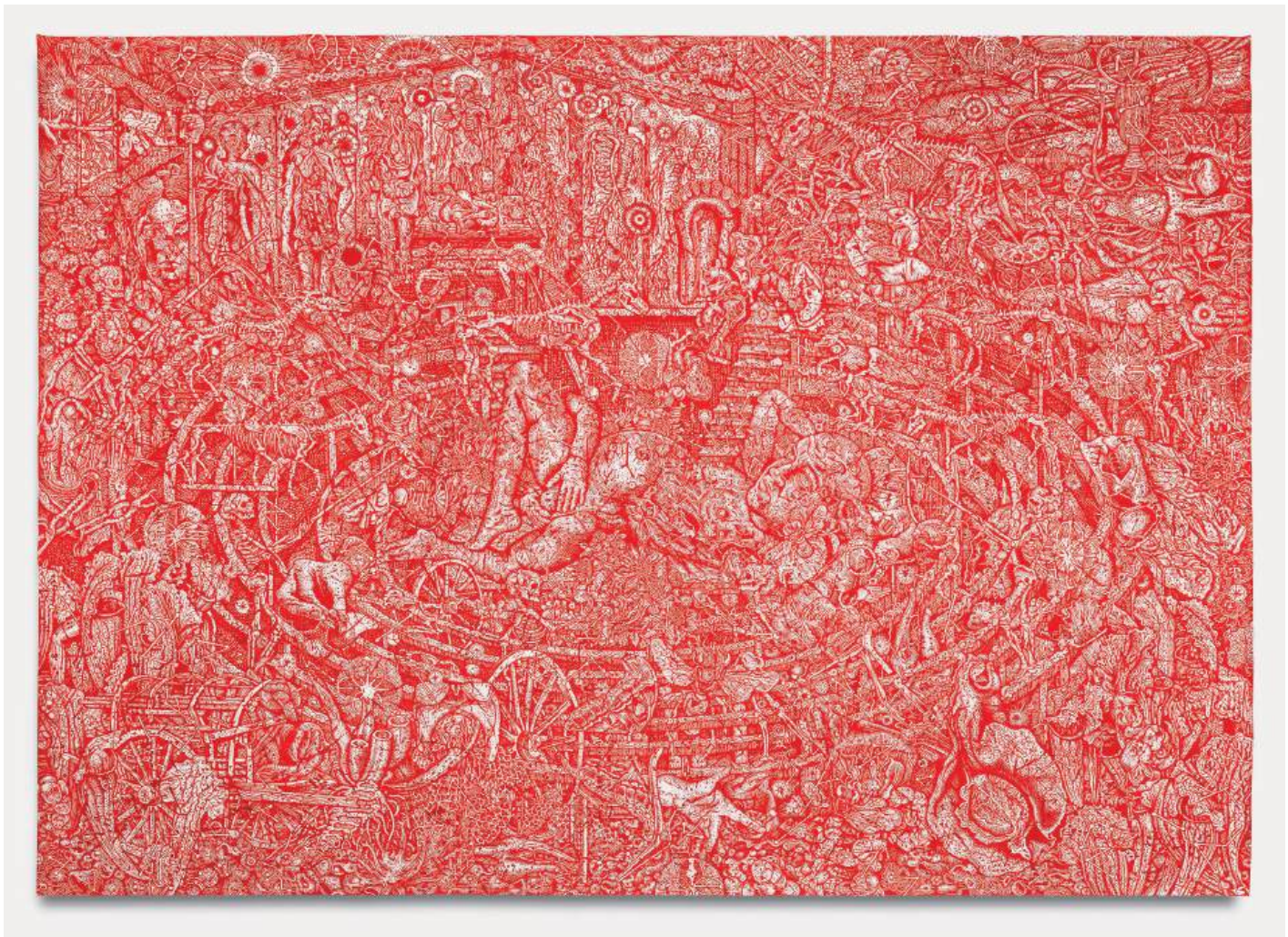
Dispositif inflammable avant renaissance - 210 x 300 cm, encre d'enluminure, piment et miel