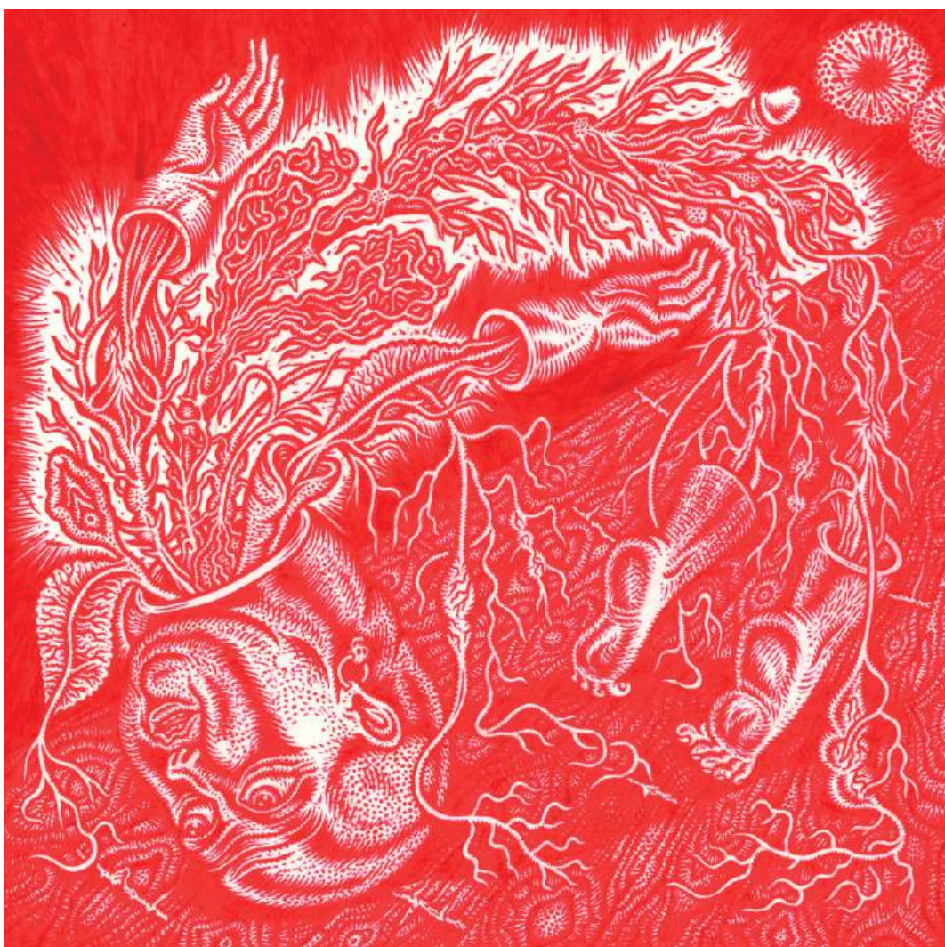
Rouge - 20 x 20 cm, encre d'enluminure, piment et miel

Intitulée Écume mercure au plexus , cette première exposition bruxelloise de Stéphane Blanquet propose une sélection de ses œuvres aux médiums pluriels : dessins, peintures, tapisseries... Elle dévoile notamment une nouvelle série de 100 dessins à l'encre bleue, « Plexus Mercure », dans lesquels se mélangent les genres avec force et finesse, où le féminin se multiplie avec le masculin, se métamorphosant et fusionnant en climax de désirs, et où les fluides ne sont qu'une série d'explosions. Sont également exposées de grandes peintures, monochromes rouges, autobiographiques, foisonnantes de détails, au format de 210 x 300 cm, qui côtoient des tapisseries chimériques aux tissages de laines et de soie pour une immersion totale dans l'univers de l'artiste.