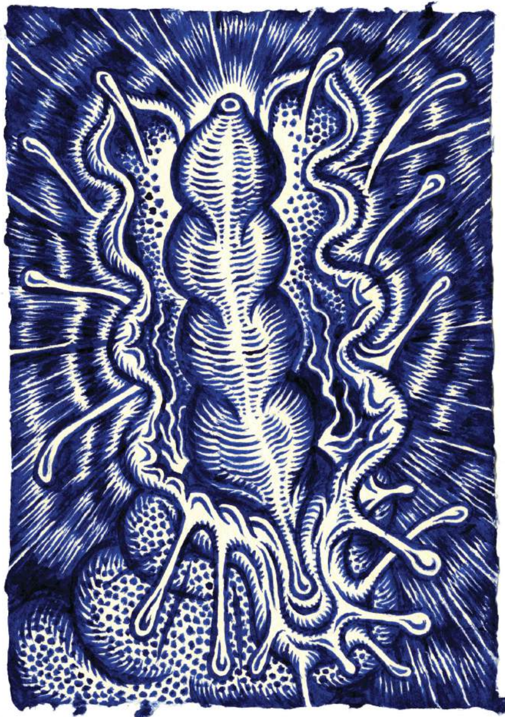
Plexus Mercure - 15 x 21 cm, encre d'enluminure, piment et miel