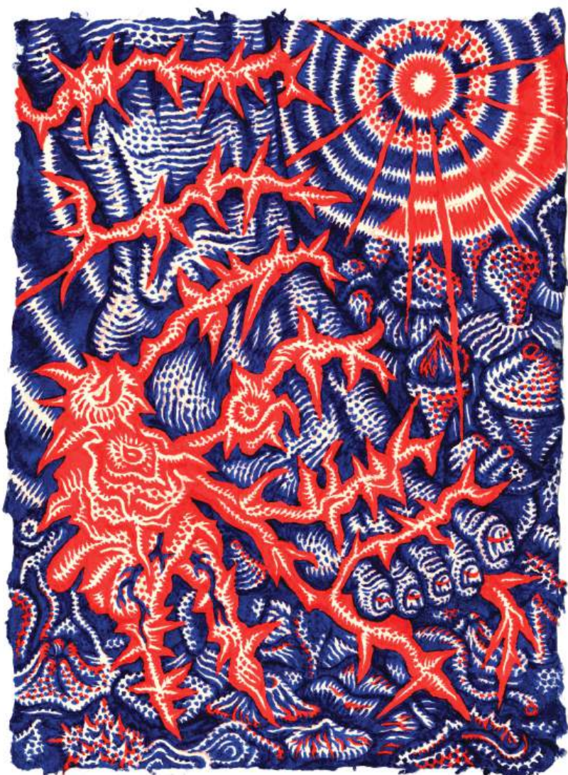
Kugelberg-Welander - 15 x 21 cm, encre d'enluminure, piment et miel