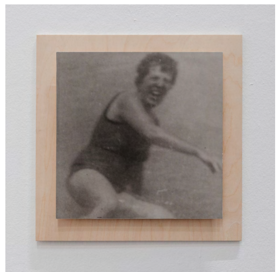
Madou rigole , 1967 / 1993 Élément extrait de la série 1967/1993 Tirage argentique contrecollé ; recadrage d'une photo de famille (auteur anonyme)

et matière photographiée. La série des Velours , réalisée en fin d'études à La Cambre, en 1989, reproduit à l'échelle 1/1 le plissé d'un morceau de tissu. 1967/1993 combine des détails très agrandis de photos retrouvées d'une journée à la plage en famille, avec des carrés de ciel (bleu) ou de sable (en noir et blanc). C'est de ce dernier ensemble qu'est issue l'image Madou rigole , portrait de la grand-mère maternelle de l'artiste.