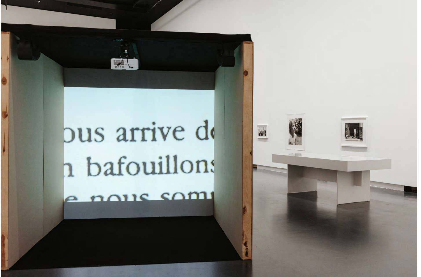
« ...puisque bafouillent aussi les astres » (vue d'exposition), BPS22 2026