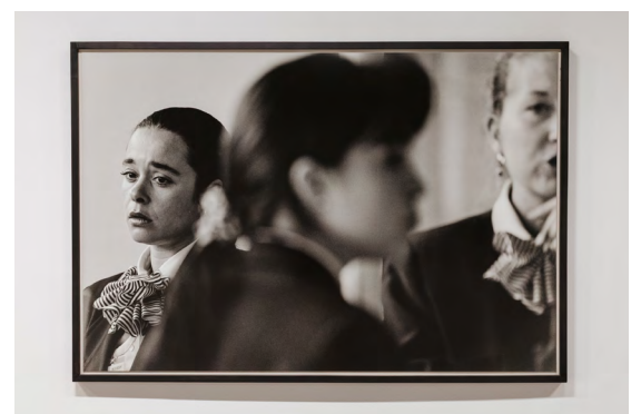
Inward Whispers #18 1997 / 1999 Tirage argentique contrecollé sur aluminium