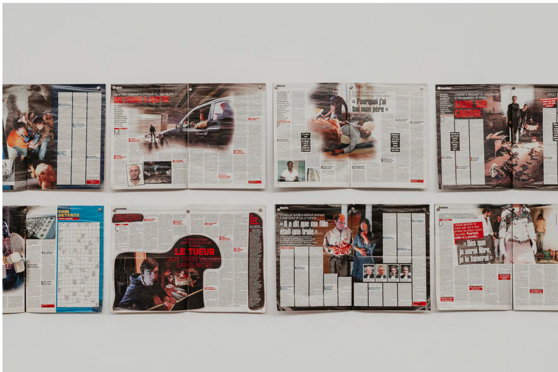
Le Nouveau Détective , 2002 - 2022 Sélection de magazines de faits divers et d'enquêtes