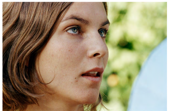
Tropismes. Le fiancé 2004 Tirage aux pigments © Chantal Maes

Réalisé dans des aéroports, Inward Whispers se concentre sur les instants où, entre deux voyageurs, les hôtesses et stewards à leur comptoir se soustraient brièvement aux flux langagiers.