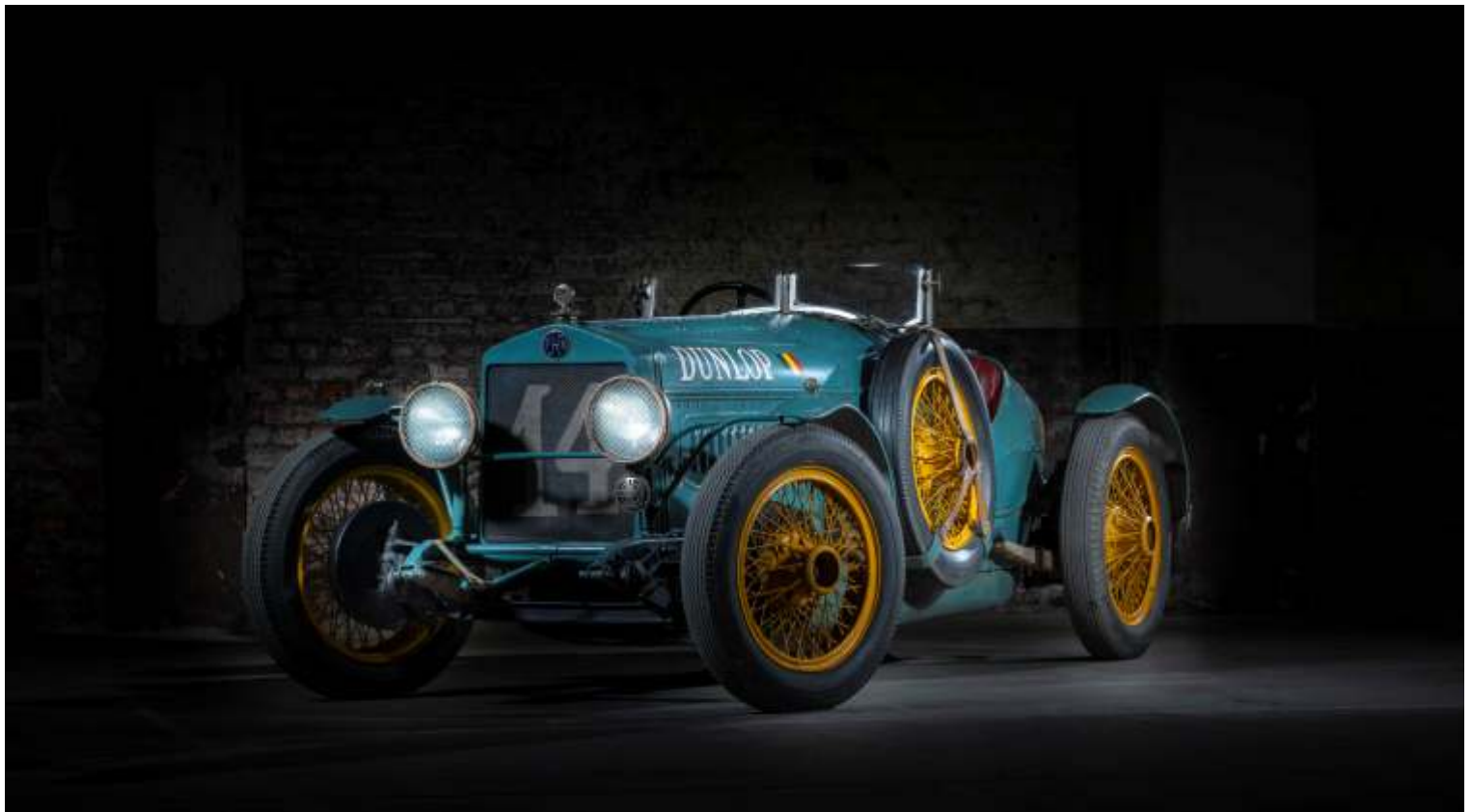
FN 1300 Sport, 1926 4 cilinders, 4 versnellingen, 1480 cc Stichting Ars Mechanica