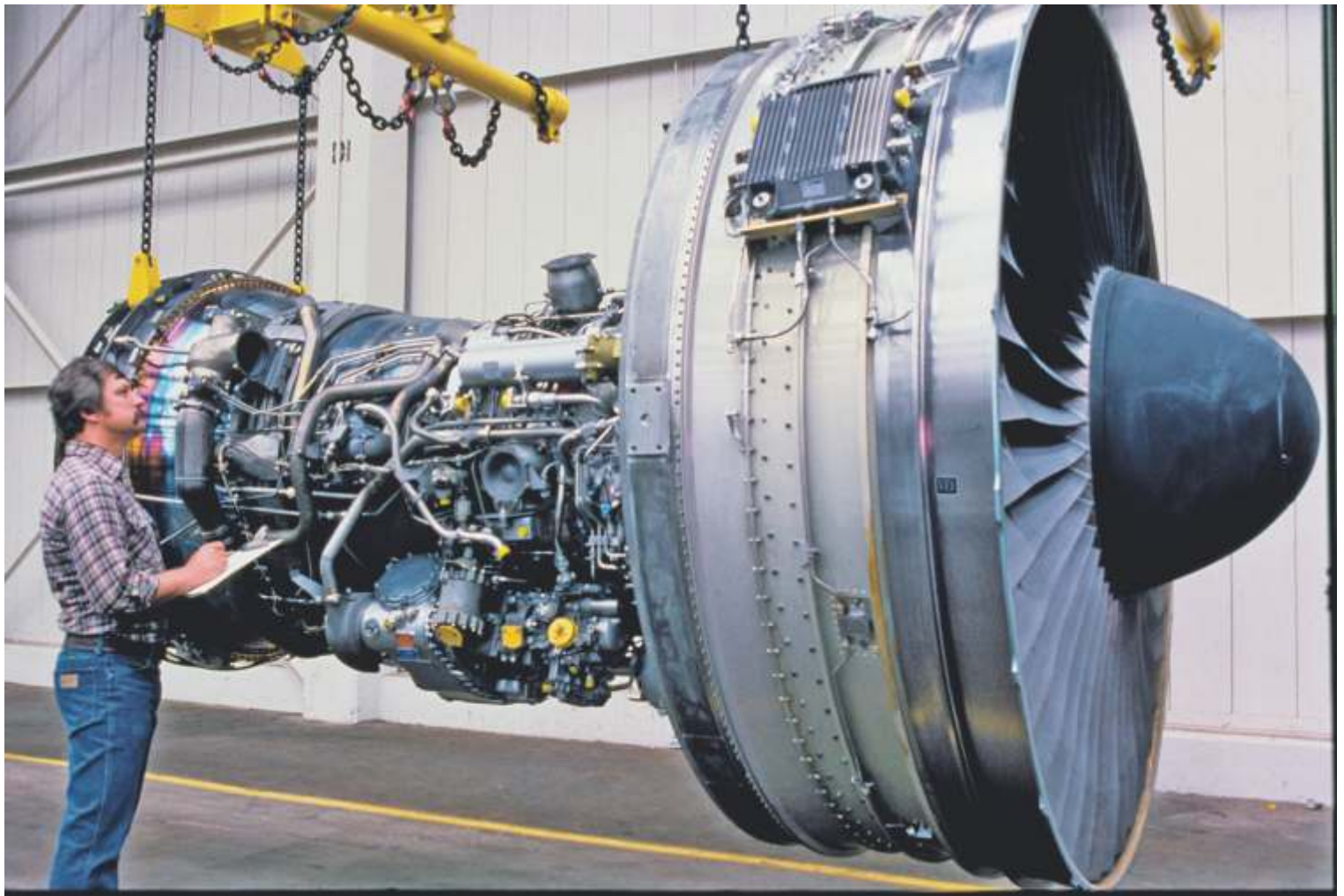
Assemblage van de JT9-D in de Pratt & Whitney-fabriek, 1975