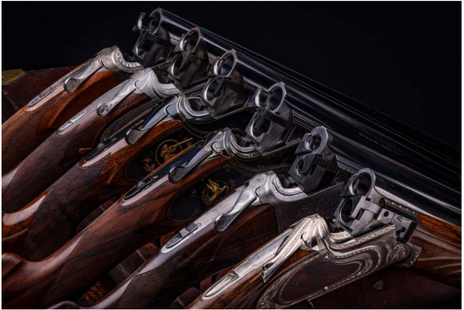
FN-Browning B25-geweerserie en Express CCS25-karabijn Stichting Ars Mechanica