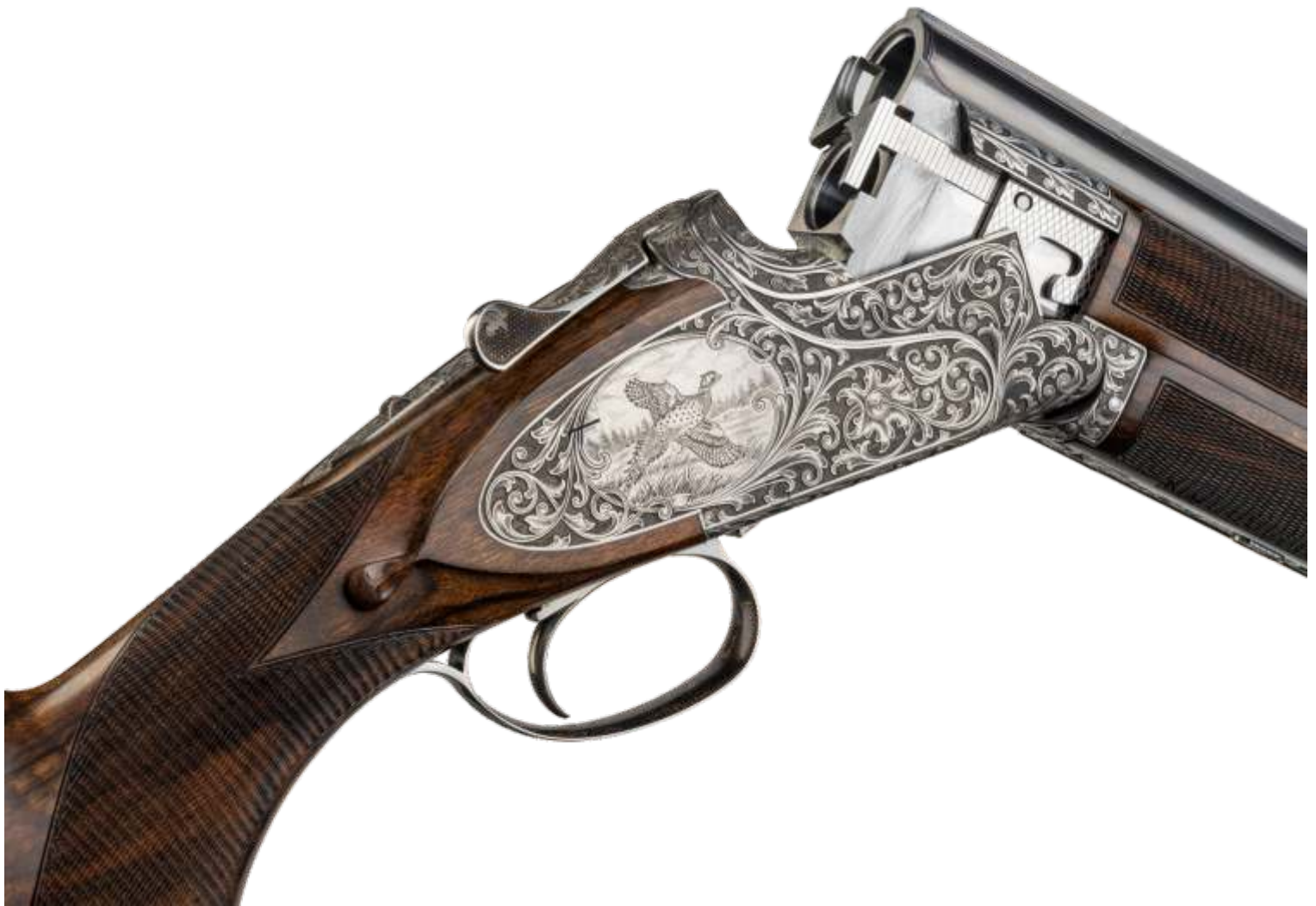
Browning B25-geweer, 100-jarig bestaan Stichting Ars Mechanica