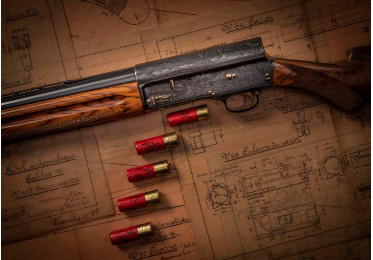
FN-Browning Auto-5 semi-automatisch geweer Stichting Ars Mechanica