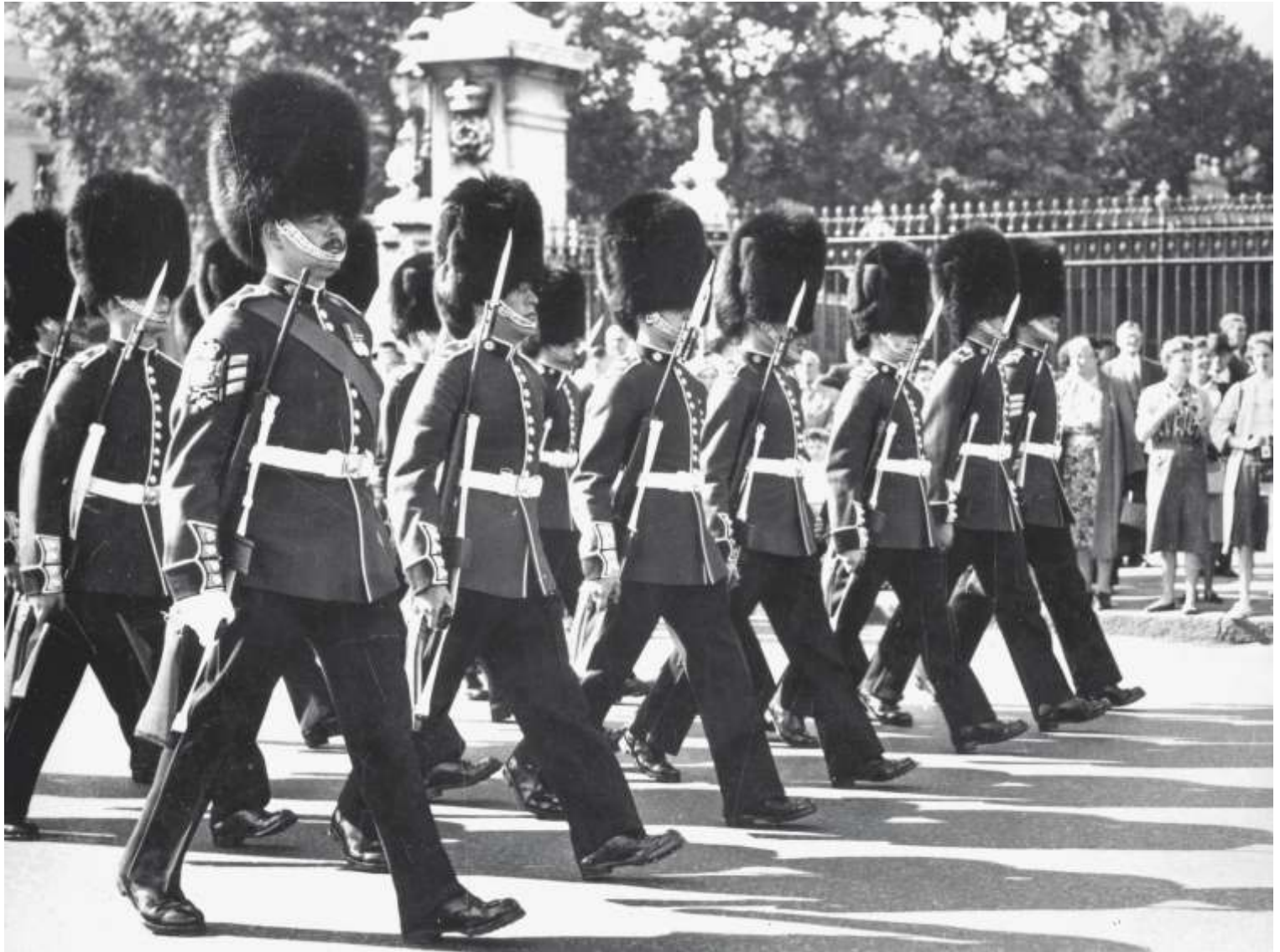
Coldstream Guards op parade met de FN FAL, door Groot-Brittannië geadopteerd als de L1A1, circa 1960 Stichting Ars Mechanica