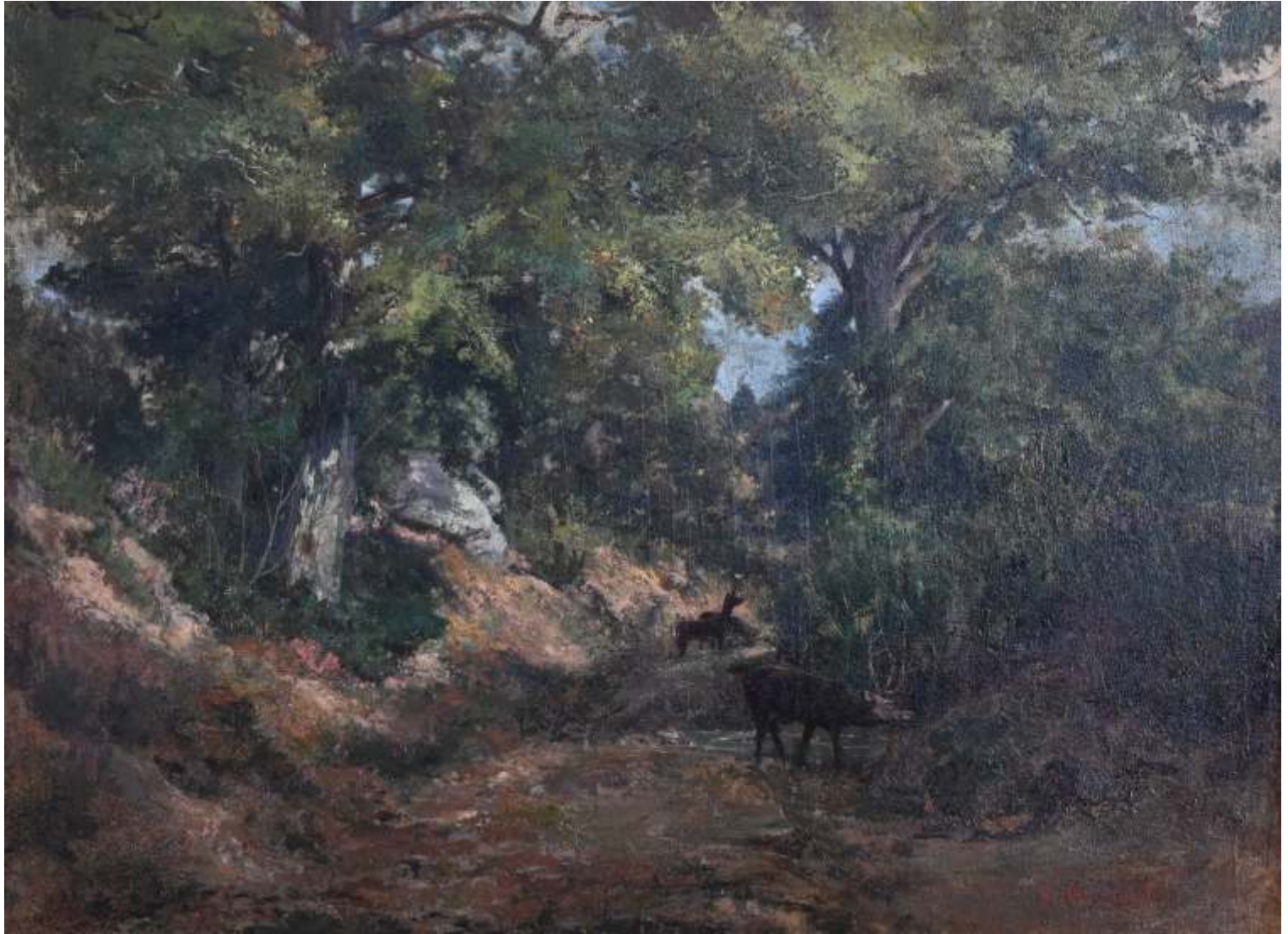
Gustave Courbet Le Cerf dans la forêt, 1867 Olieverfschilderij op canvas Musée du Château de Flers