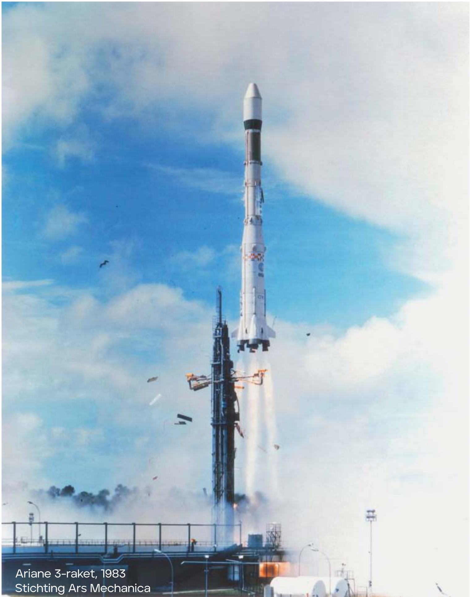
Ariane 3-raket, 1983 Stichting Ars Mechanica