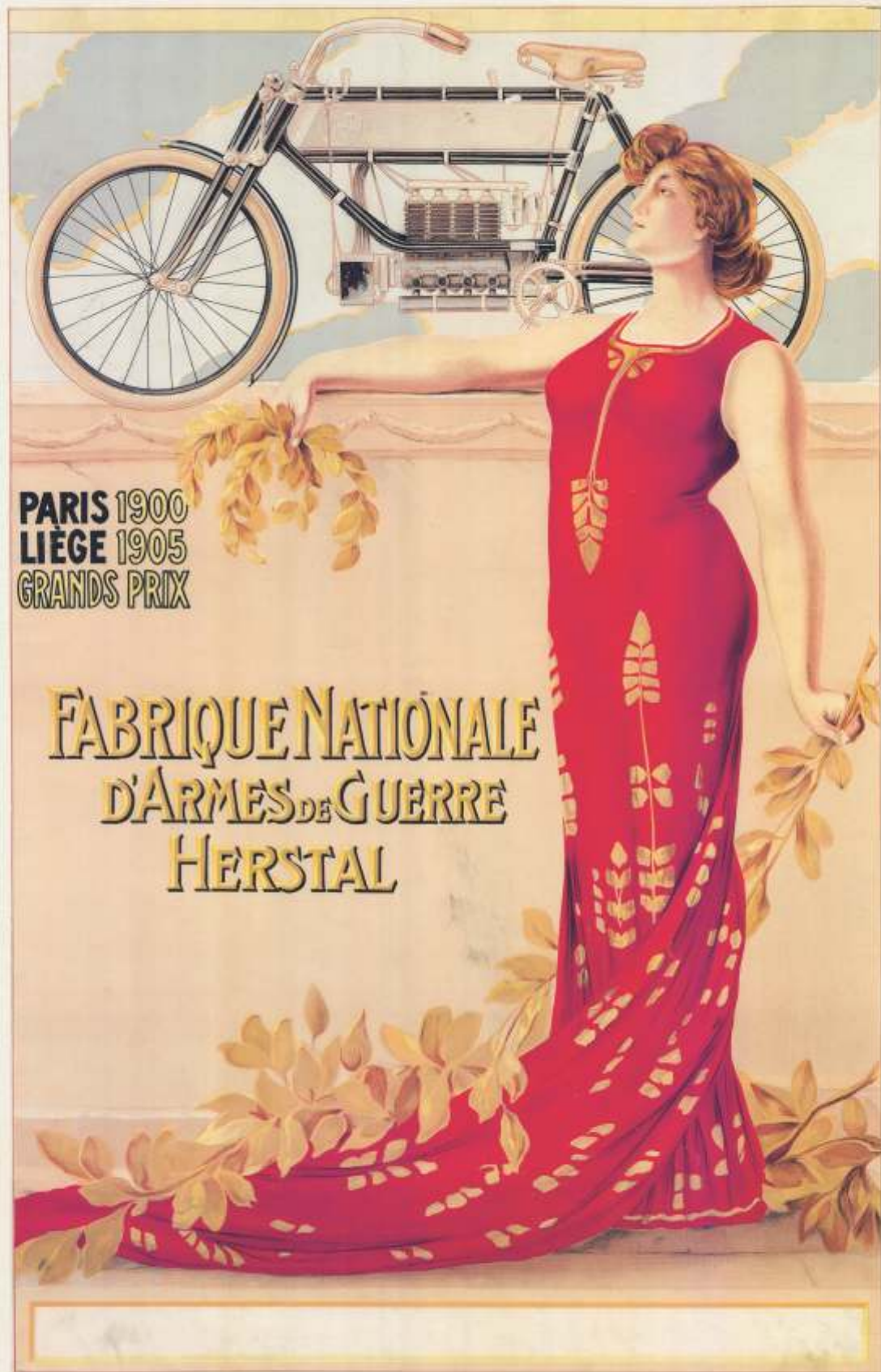
Poster van Fabrique Nationale d'Armes de Guerre, begin 20e eeuw