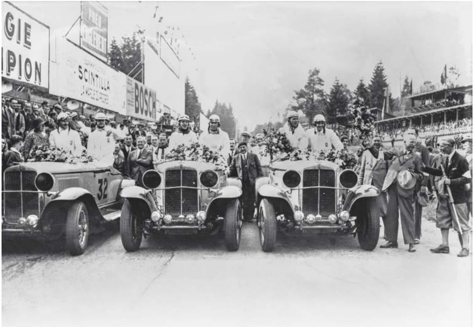
De drie Prins Boudewijn-viercilinderauto's die de koningsbeker van de 24 uur van Spa wonnen op het circuit van Spa-Francorchamps, 1933 Stichting Ars Mechanica