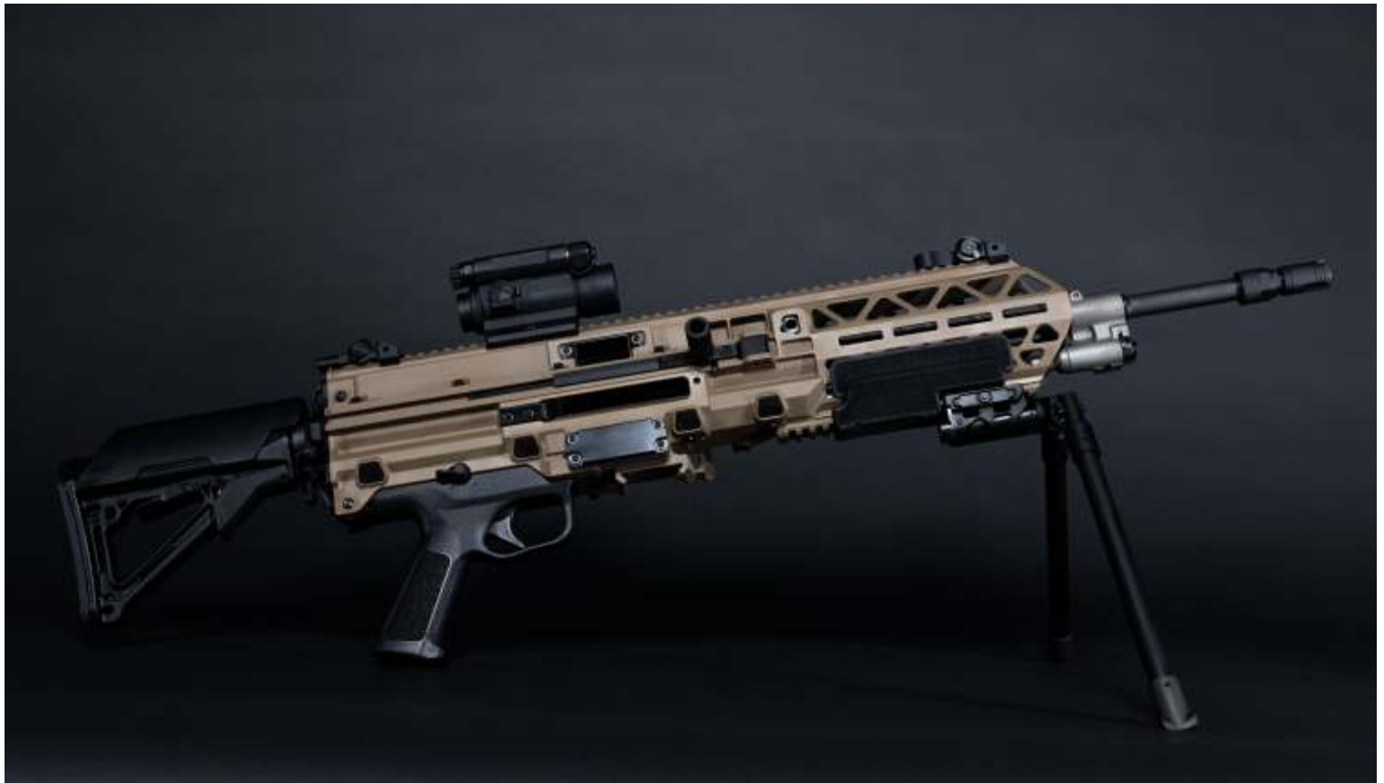
FN EVOLYS ultralicht machinegeweer Stichting Ars Mechanica