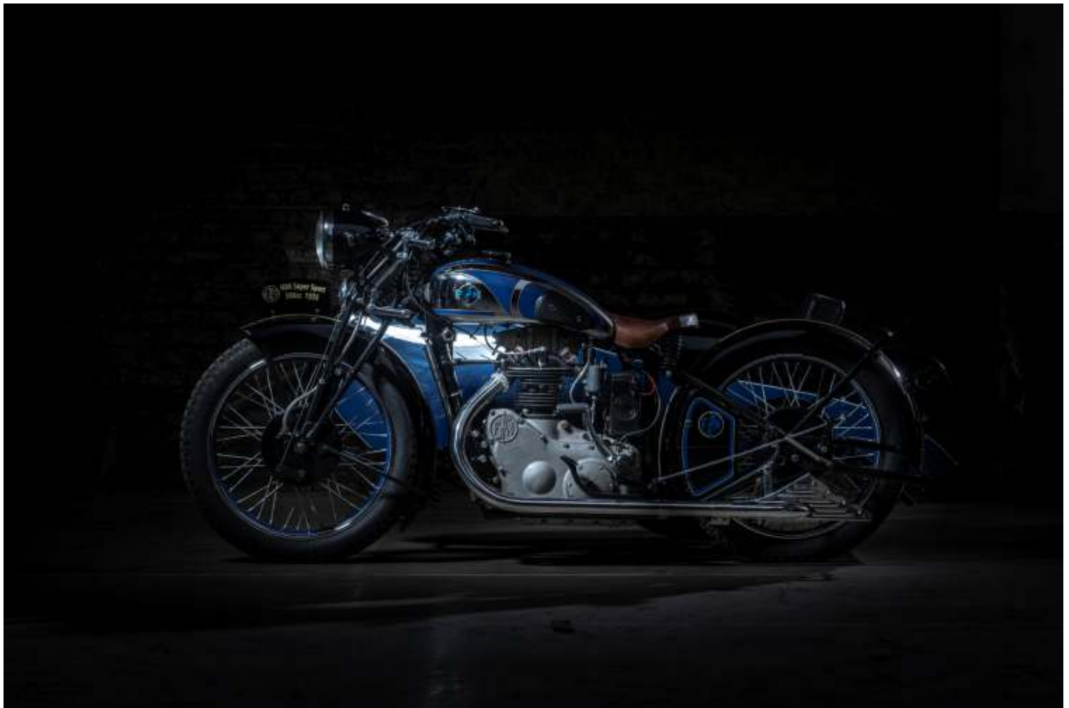
FN M86-motorfiets en Luxe-zijspan, 1936 Eencilinder, 4 versnellingen, 497 cc Stichting Ars Mechanica