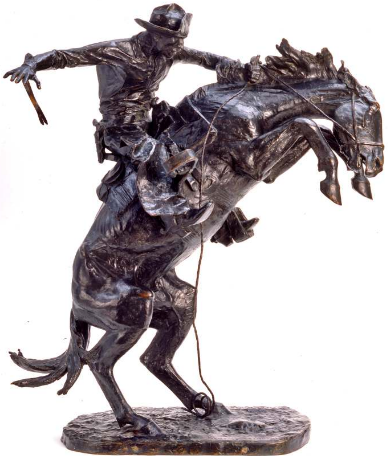
Frederic Remington The Broncho Buster, 1909 Bronz Buffalo Bill Center of the West, Cody, Wyoming