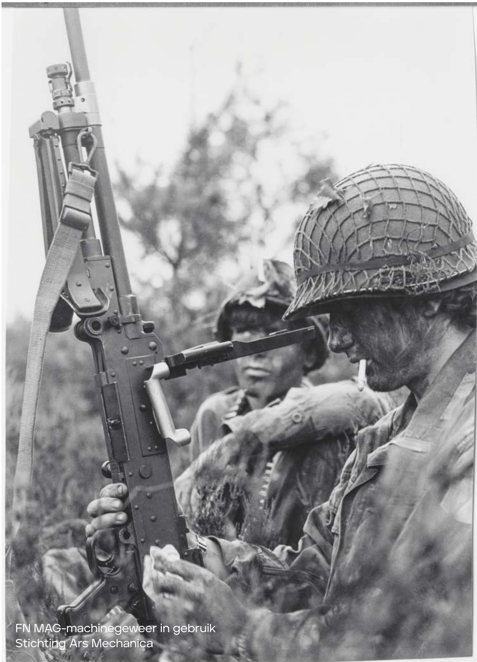
FN MAG-machinegeweer in gebruik Stichting Ars Mechanica