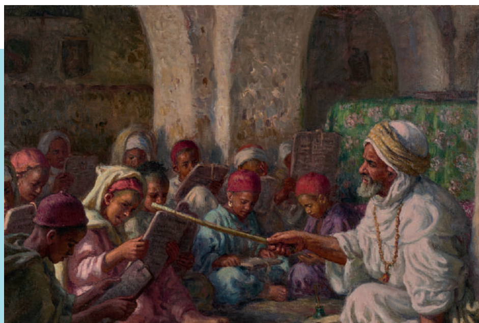
Étienne DINET, L'école coranique - 1919 - Huile sur toile

Adjugé le 30 décembre 2020 à Marrakech - 6,4 millions MAD / 590 000 € frais inclus