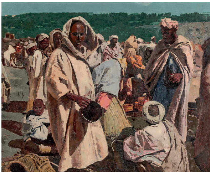
Jacques MAJORELLE, Scène de Souk , Marrakech - Circa 1942-1945 Huile sur panneau d'Isorel Adjugé le 30 décembre 2020 à Marrakech 1,1 millions MAD / 105 000 € frais inclus

Six des sept œuvres de Jacques Majorelle trouvaient également preneur dont la Scène de Souk , Marrakech – Circa 1942-1945, adjudgée à 1,1 millions MAD / 105 000 €.