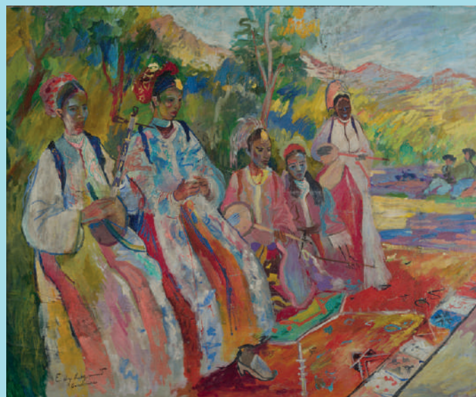
Edy LEGRAND, Musiciennes à Goulimine Huile sur toile Adjugé le 30 décembre 2020 à Marrakech 2,1 millions MAD / 193 000 € frais inclus

Une huile sur toile d'Edy Legrand Musiciennes à Goulimine multipliait par quatre son estimation (55 000 – 77 000 €) pour atteindre 2,1 millions MAD / 193 000 € frais inclus.