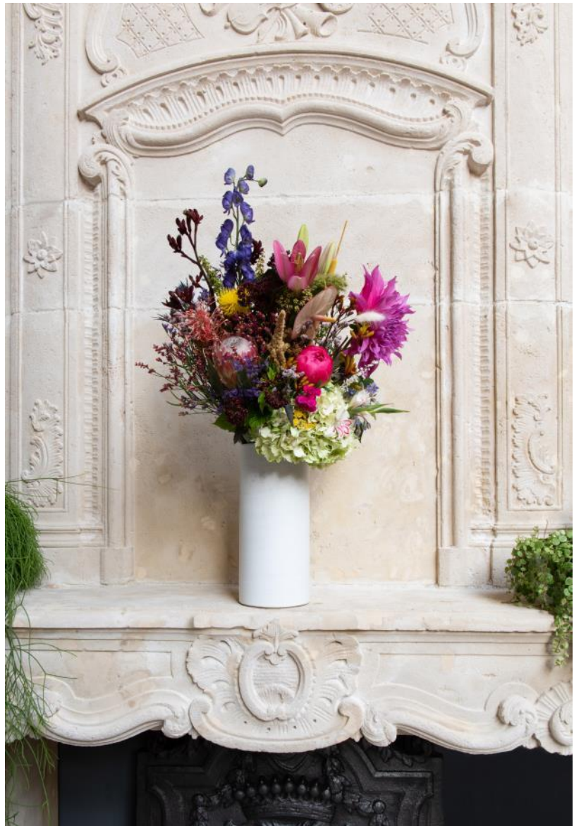
Cheminée en pierre, vente Architecture & Garden Statuary , le 24 septembre 2018 à Paris.