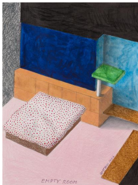
Ettore Sottsass, Empty Room , 2004

Le 21 mars dernier, le département Maîtres anciens & du 19 ème siècle d'Artcurial proposait aux enchères un pastel de Le Brun représentant Charles Perrault. L'œuvre, préemptée par le Château de Versailles, était une étude préparatoire pour un tableau disparu. Pourtant, suite à cette vente, le portrait à l'huile a resurgi ! Il sera l'une des œuvres majeures de la vacation organisée par Artcurial, en novembre 2018.