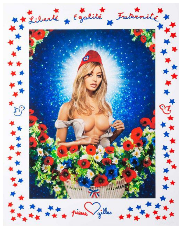
Pierre & Gilles, Zahia , 2017, impression et sérigraphie à 25 exemplaires, signés et numérotés par l'artiste, 120 x 95cm, 6 000 €

Le label MEL Publisher a été créé en 2014 par Michel-Edouard Leclerc et Natalia Olzoeva-Leclerc. Cette maison d'édition a pour but de promouvoir et rendre accessible au plus grand nombre les œuvres d'artistes contemporains dont Michel-Edouard Leclerc défend le travail. Éditeur de