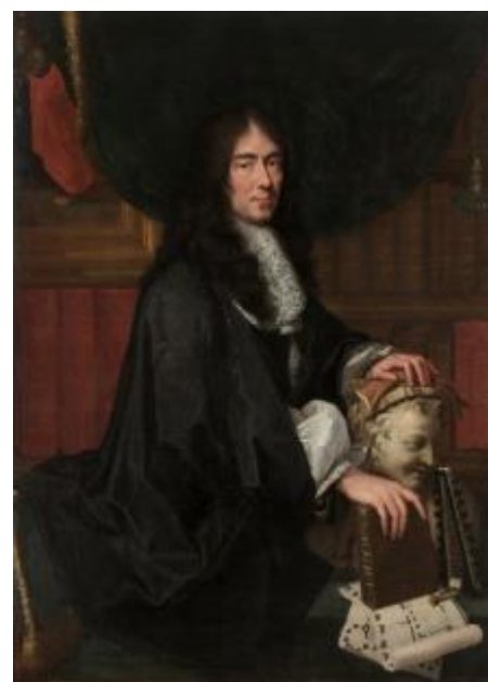
Charles Le Brun, Portrait de Charles Perrault , vers 1670, huile sur toile