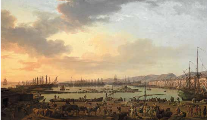
À gauche : Joseph Vernet, Troisième vue de Toulon, vue du vieux port, prise du côté des magasins aux vivres