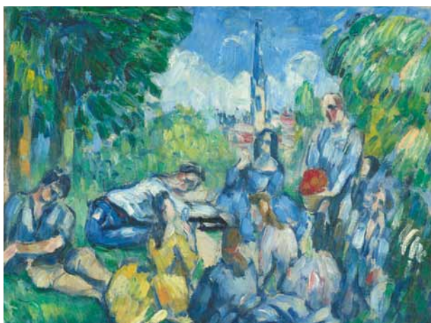
Paul Cézanne, Le Déjeuner sur l'herbe, collection Jean Walter et Paul Guillaume