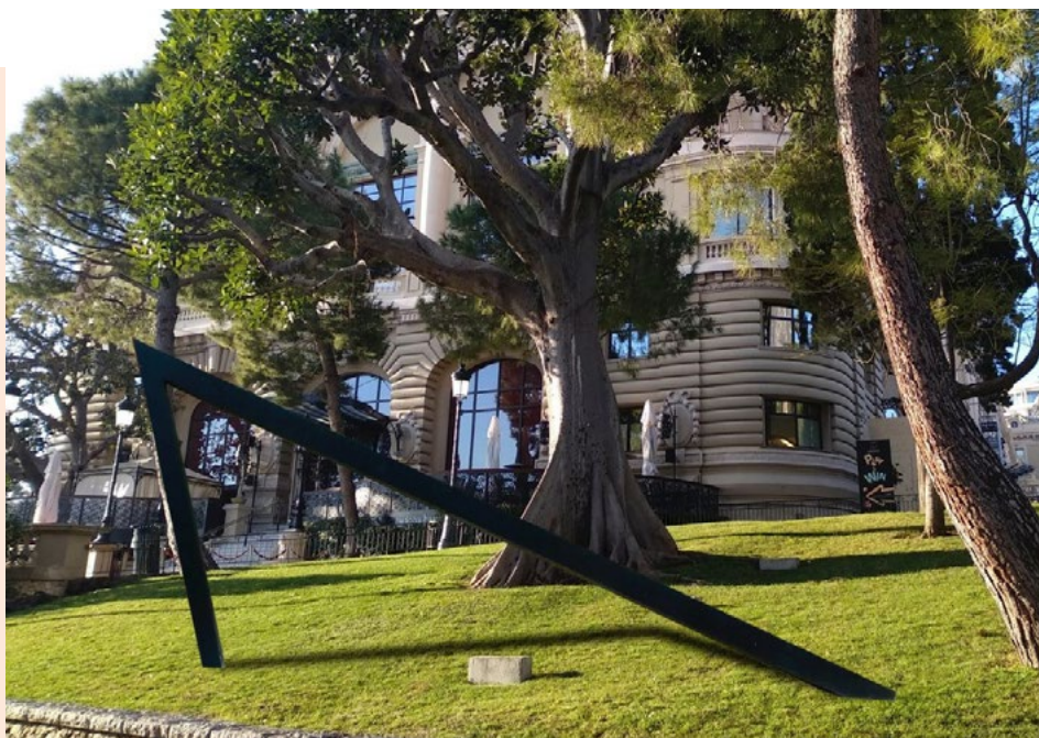
BERNAR VENET 56.5° Angle, 1984 Acier laqué noir Estimation : 120 000 - 180 000 €