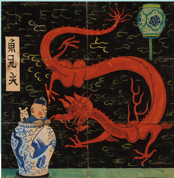
Première version de la couverture originale du Lotus bleu (1936)