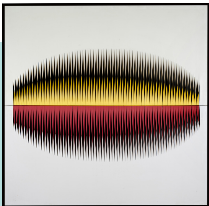
Walter LEBLANC Torsion B216 Mixed media

A cette occasion, sera présentée une pièce exceptionnelle et inédite sur le marché de l'art: le dessin réalisé par Georges Rémi dit Hergé pour la couverture initiale de l'album Le Lotus bleu de 1936. Ce dessin réalisé à l'encre de Chine, aquarelle et gouache sur papier est estimé entre 2 et 3 M€.