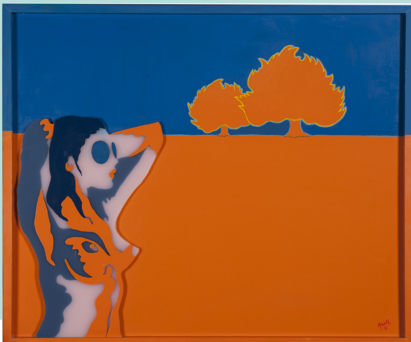
Evelyne AXELL Les Arbres - 1971 Enamel on Plexiglas and formica