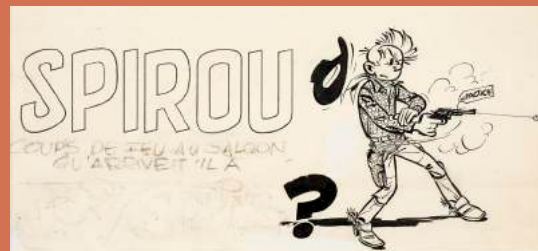
André FRANQUIN Coups de feu au saloon ! Encre de Chine, crayon de papier, crayon bleu et gouache correctrice pour le bandeau d'annonce du journal Spirou du 21 juin 1956 - 13 x 28 cm Estimation : 5 000 - 7 000 €