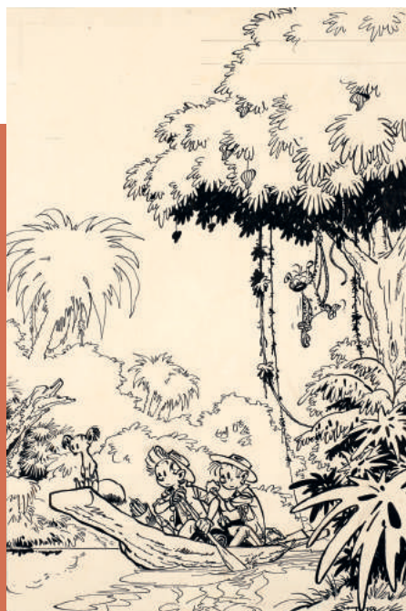
André FRANQUIN Recueil Spirou n°49, La Pirogue Encre de Chine, crayon bleu et mine de plomb sur papier pour la couverture du Recueil Spirou n°49 publié le 1er avril 1954 - 37,50 x 28,50 cm Estimation : 350 000 - 450 000 €

Le dessin Coups de feu au saloon ! de Franquin, illustre Spirou en justicier, tirant d'un pistolet à bouchon factice, complètera cet ensemble. Il est estimé entre 5 000 et 7 000 €.