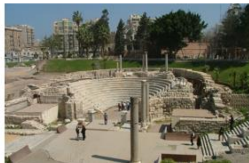
De gauche à droite : Le Phare d'Alexandrie selon Fischer von Erlach (1721). © Libre de droits / Buste colossal ptolémaïque, Musée royal de Mariemont. © Musée royal de Mariemont / Amphithéâtre romain de Kom el-Dikka, Alexandrie. © Libre de droits