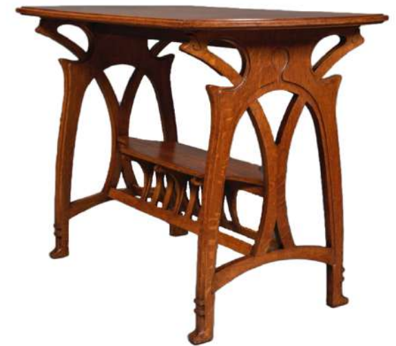
Gustave Serrurier-Bovy Eiken bijzettafel 1899 H. 75 cm B. 103,5 cm D. 59cm

Een eiken variant van het model in de slaapkamer tentoongesteld in de winkel "L'Art dans l'habitation", een dochteronderneming van Serrurier-Bovy gevestigd op 54 rue de Tocqueville in Parijs. Deze showroom werd geopend in 1900 en presenteerde klanten complete meubelsets, waaronder eetkamers, slaapkamers en studeerkasten. In 1904, op basis van zijn Parijse succes, verhuisde Gustave Serrurier zijn winkels van de rue de Tocqueville naar een groter, prestigieuzer adres op 37 boulevard Haussmann. Een soortgelijk model in mahoniehout wordt permanent tentoongesteld in het Musée d'Orsay, dat het in de jaren 1980 verwierf.