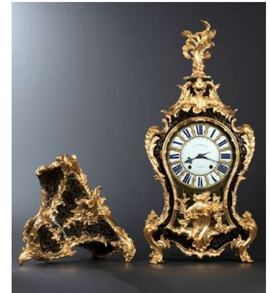
Verguld brons gemerkt "C Couronné" Gedeeltelijk ingelegd met schildpad en gegraveerd messing Afmetingen cartel: 88,5 x 42 x 19 cm Afmetingen console: 36,5 x 47 x 24,5 cm