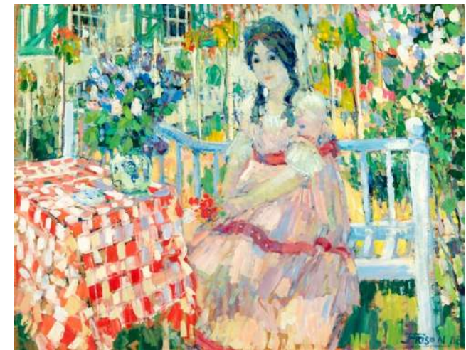
Olie op doek 70 x 90 cm Periode : 1918

Jehan Frisons meesterwerk "Printemps", met een jonge vrouw in een roze jurk, dateert uit het hoogtepunt van zijn fauvistische periode. Een tijdgenoot van Rik Wouters, Ferdinand Schirren, Anne Pierre De Kat, ... Frison was lid van de Brabantse Fauves. In dit schilderij maakt hij dan ook typisch gebruik van pure, opvallende kleuren. Op het eerste gezicht geeft het werk een indruk van vitaliteit, passie en waardering voor kleur. Als je het werk echter even laat rusten, zul je merken dat het rust en sereniteit uitstraalt.