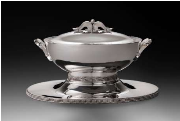
1956 26 x 44 x 27 cm 3.360 gr

© Jean Després © Galerie Fr. Janssens van der Maelen