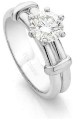
Origineel Antilope-model 1983