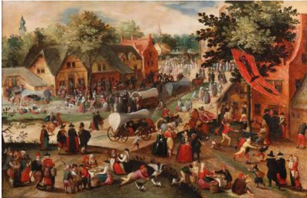
Olieverf op eikenhouten paneel 68 x 105 cm

© Maarten van Cleve © Jan Muller Antiques