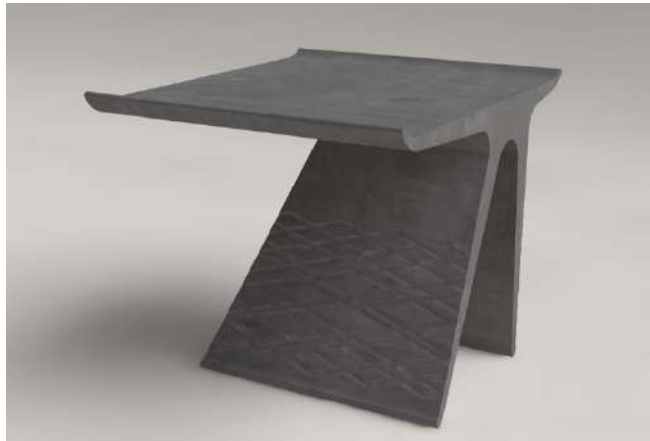
Salontafel Edouard Boulmier Koolzuurvrij beton Linnen vezel

Hoewel oude en moderne kunst de pijler vormen van Antica Namur, heeft de beurs via haar exposanten en galeristen ook een eigentijds aanbod, met stukken variërend van meubels tot schilderijen, keramiek, fotografie en meer.