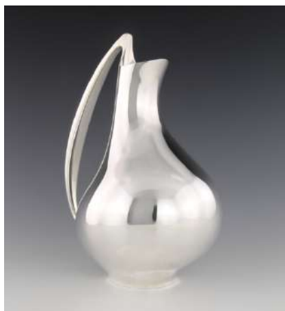
925 sterling silver Henning Koppel Geproduceerd door Georg Jensen Copenhagen 1989 Dimensies: H: 29.2, ca. Ø: 22.9 cm, B: 15.2 cm 1,383 g

© Georg Jensen © Henning Koppel © Uta Koenig