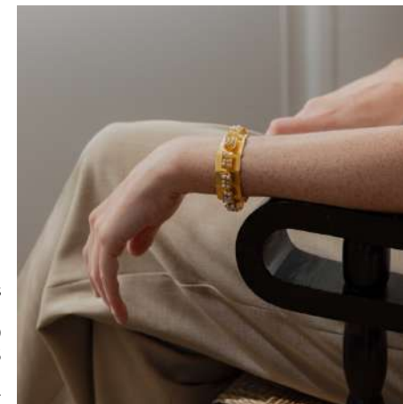
21,6K (900) geelgoud en parels Kunstenaarsstempel Gestempeld 900 1965 17,5 cm 78,6 gr