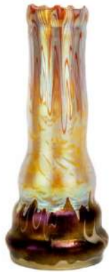
Fabricant: Johann Loetz Witwe Beschrijving: Vaas Phänomen Genre 358 Periode: 1900

© Johann Loetz Witwe © Antiques Euporium