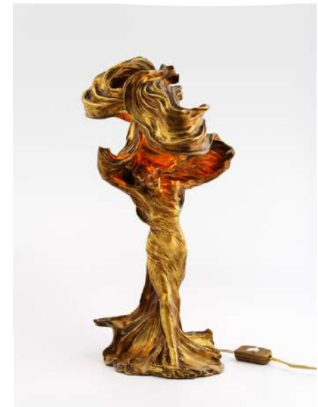
Vuurvergulde brons, met originele lampfitting in werkende staat Periode : ca. 1900 H 46 x B 23 x D 26 cm

De Loïe Fuller lamp van Raoul Larche is iconisch omdat Loïe Fuller zelf iconisch was. Ze was een legendarische danseres, vertegenwoordigd door de grootste kunstenaars van het fin de siècle. Ze benadrukte het lichtspel in haar dans, wat weerspiegeld wordt in deze sculptuur. Larche maakte een aantal voorstellingen van Fuller, waarvan de twee lampen de bekendste zijn. Ze maken op sierlijke wijze deel uit van de renaissance van de decoratieve kunsten onder de vlag van de Art Nouveau aan het einde van de 19e eeuw. Deze uitgave is in veel opzichten bijzonder mooi: ciselering, vergulding, originele patina, enz. Het is te vinden in alle boeken over Art Nouveau en in veel musea over de hele wereld.