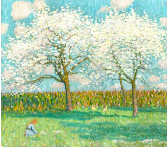
Olieverf op doek 81 x 91 cm Periode : 1914 gesigneerd