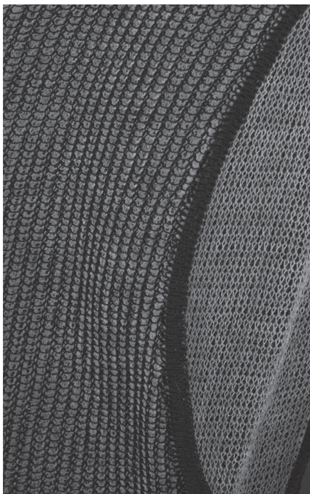
Détail Annermie Verbeke, S/S 1999

jonglant avec les références, mais aussi Lætitia Crahay magicienne de bibis surprenants bousculant l'historique Maison Michel.