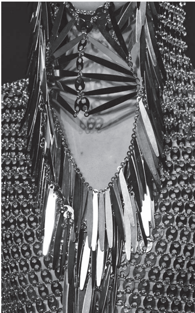
Robe à cagoule en assemblage de pièces métalliques «eight», thème «prêtresse mystique» de la collection Paco Rabanne by Julien Dossena, AW 2020-2021

Les dernières Leçons de Mode sont à écouter sur: fashionandlacemuseum.brussels/fr/lecon-de-mode