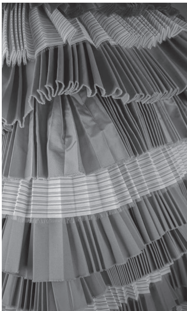
Robe à volants plissés, coton et taffetas de soie. Modèle de défilé de La Cambre Marine Serre, 2015