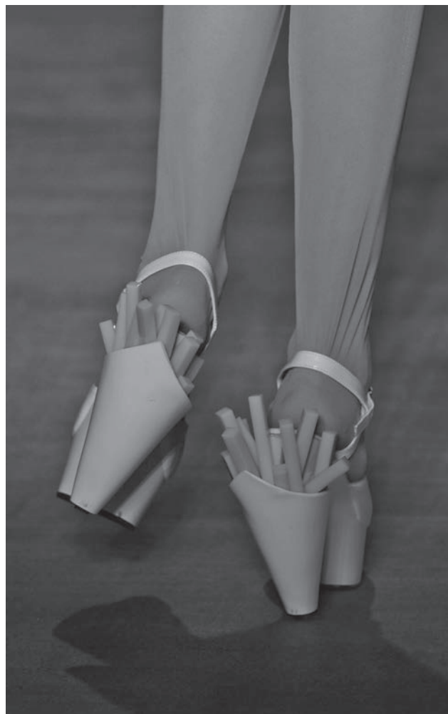
Chaussures Cornet de frites Jean-Paul Lespagnard, Festival d'Hyères 2008

«Brussels Touch», esprit de Bruxelles es-tu là ?