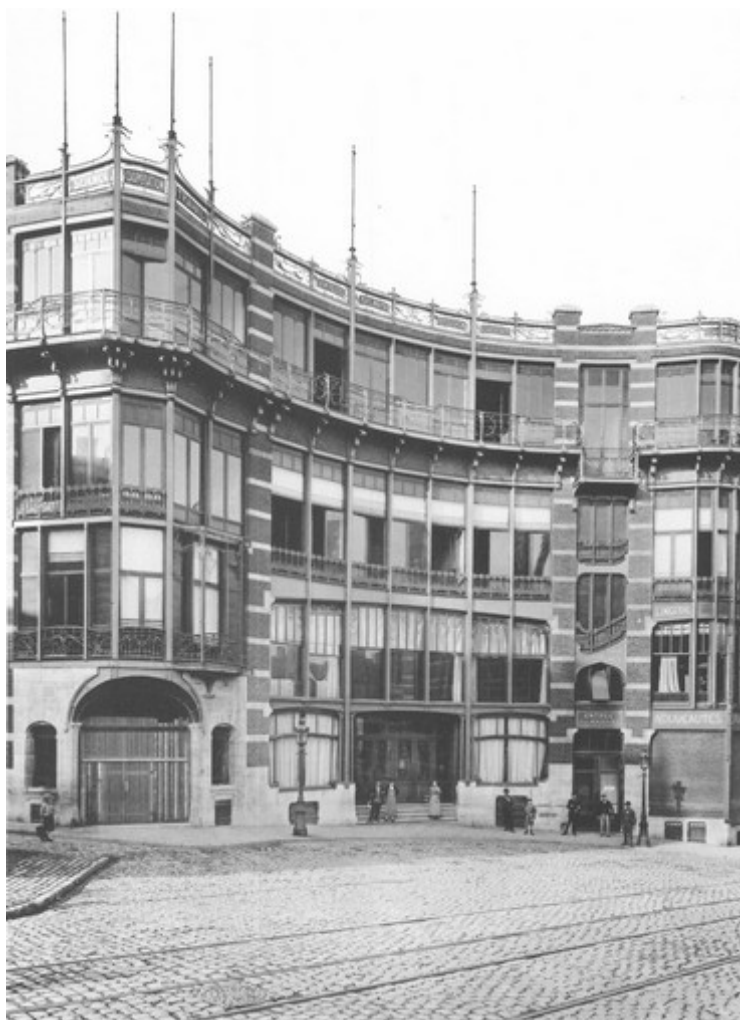
Ernst Wasmuth, planche extraite de "Neubauten in Brüssel", 1899.

DISPONIBLE AU MUSÉE HORTA À PARTIR DU 19 DÉCEMBRE 2019