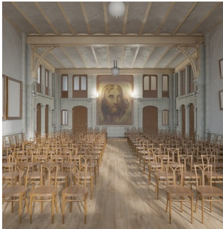
Laboratoire Alice, vue de la salle Matteoti (draft), 2019.

Architecte et professeur à la Faculté d'architecture La Cambre - Horta de l'ULB Chercheur au sein du Laboratoire Alice de la Faculté d'architecture La Cambre - Horta de l'ULB