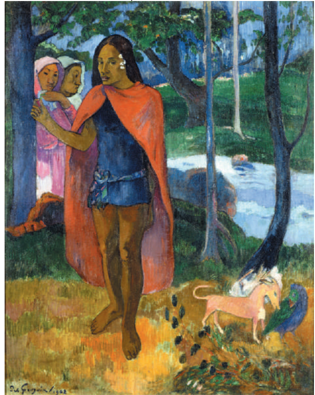
Paul Gauguin, Le Sorcier d'Hiva-Oa , Huile sur toile, 1902.

Ces acquisitions témoignent d'un engagement en faveur de la création artistique et occupent aujourd'hui une place centrale dans les collections. Elles sont prolongées par des achats réalisés à Paris dans la même période.