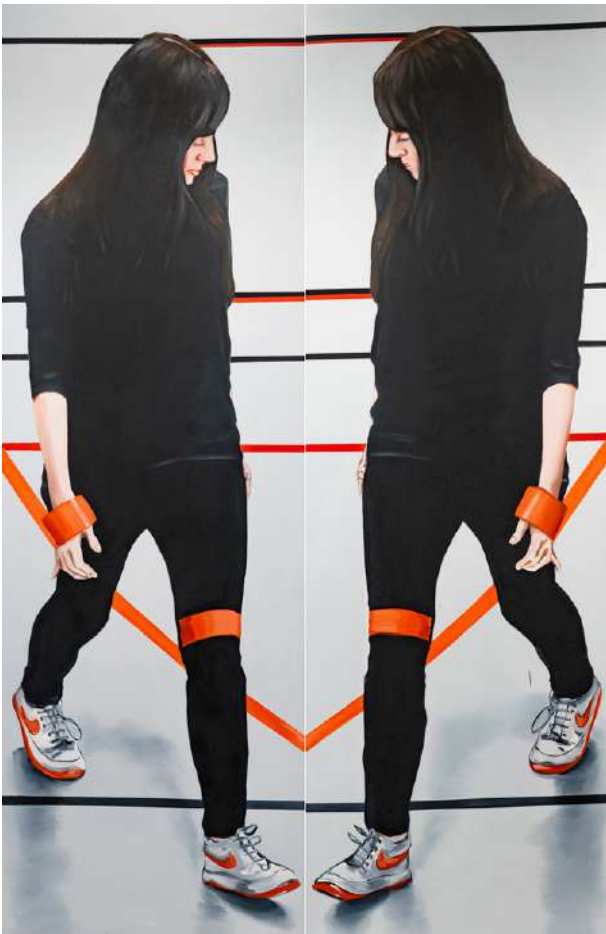
Charlotte Beaudry, Déesse-02 , huile sur toile, s.d.