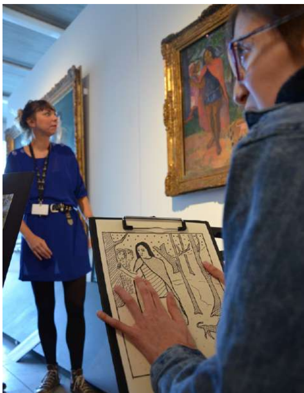
Dispositif de médiation pour personnes en situation de handicap visuel

La parole est, également, donnée aux participants aux projets et activités menés par le service au cours des 10 dernières années, afin de mettre en lumière leurs expériences et leurs regards.