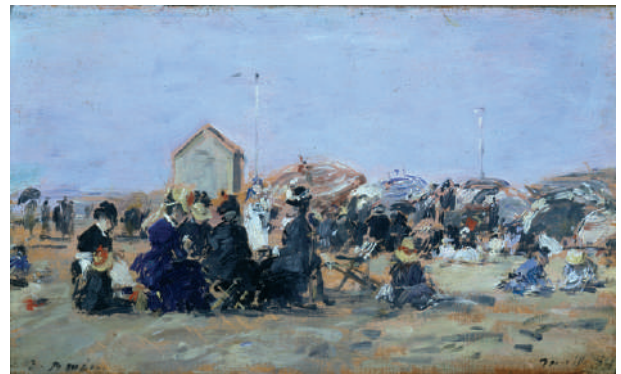
Eugène Boudin, Trouville, scène de plage à la cabine , huile sur bois, vers 1860

La formation des collections remonte au 18 e siècle, sous l'impulsion de collectionneurs privés. En 1799, le Chanoine liégeois Henri Hamal (1744–1820) cède à la Ville plus de 8 000 dessins et gravures, en grande partie rassemblés à Rome pour servir de modèles à l'Académie des Beaux-Arts ; cet ensemble constitue encore la base de la collection du Cabinet des Estampes et des Dessins, créé en 1952. En 1819, Louis-Pierre Saint-Martin offre plus de 50 tableaux, formant le noyau des collections du Musée des Beaux-Arts. Au 19 e siècle, les collections s'enrichissent encore : en 1887, Léopold Donnay lègue près de 300 œuvres, dont 9 tableaux d'Eugène Boudin ; en 1900, Eugène Dumont donne 39 tableaux (dont Le Bassin du commerce au Havre de Claude Monet) puis, Charles-Joseph Horion cède près de 600 gravures anciennes. L'enrichissement se poursuit jusqu'en 1938 avec l'achat régulier par le Musée d'œuvres modernes, d'artistes français, et plus spécifiquement de l'École de Paris.