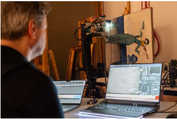
Analyses scientifiques de l'œuvre La Violoniste de Kees Van Dongen