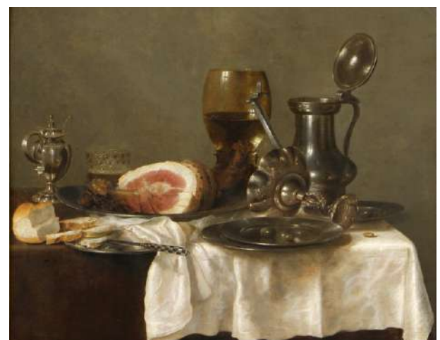
Pieter Claesz Heda (attribué à), Nature morte , Huile sur bois, 1660 avec et sans les ajouts tardifs