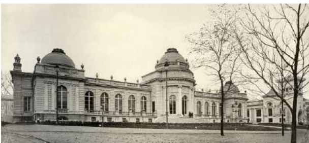
Palais des Beaux-Arts, exposition universelle de 1905.

Peu à peu, l'idée d'un regroupement des collections s'impose. En 2011, elles sont, à nouveau, réunies à l'Îlot Saint-Georges, renouant avec une vision plus homogène des Beaux-Arts. Cette longue évolution trouve son aboutissement en 2016. Après 5 années de travaux, l'ancien bâtiment du MAMAC devient La Boverie offrant, désormais, un cadre entièrement rénové, répondant aux normes actuelles de bonne conservation, pour abriter le parcours permanent du Musée des Beaux-Arts de Liège.