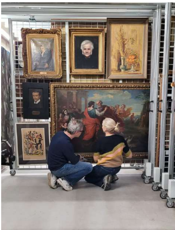
Vérification de l'état des œuvres dans les réserves muséales

C'est également dans les réserves que les œuvres sont inventoriées et documentées avec précision. Elles y acquièrent une identité au sein des collections et font l'objet d'un suivi régulier. Les réserves jouent, aussi, un rôle central dans la gestion logistique des œuvres, qu'il s'agisse de prêts pour des expositions nationales ou à l'étranger, de restaurations ou des délocalisations. Elles constituent, enfin, un lieu de travail pour les chercheurs qui y étudient, directement, les œuvres.