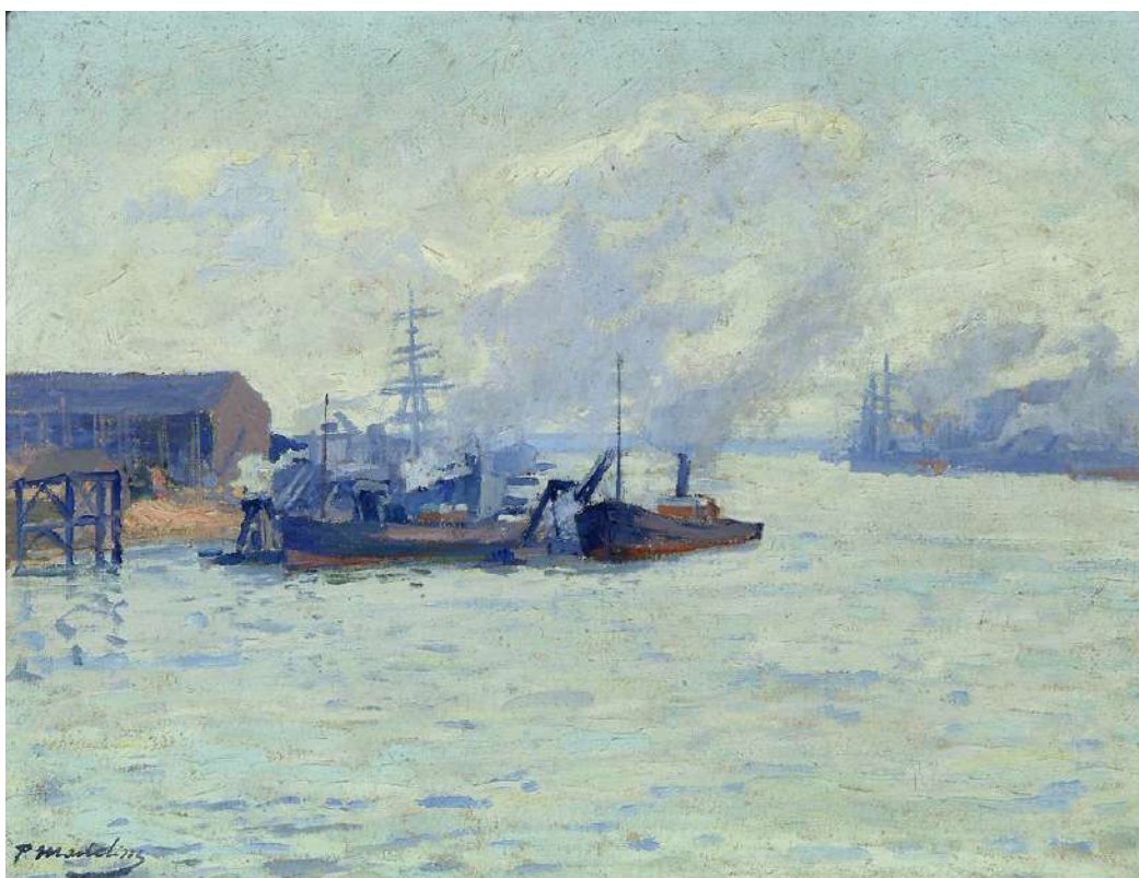
Paul Madeline, Remorqueurs : avant-port de Nantes , huile sur toile, 4 e quart du 19 e siècle

Les coulisses d'une Collection met en récit ces métiers et savoir-faire en donnant à voir les processus, les choix et les questionnements qui accompagnent chaque œuvre, de son entrée dans les collections à sa présentation au public. Le Musée apparaît, ainsi, comme un espace vivant, en constante évolution, où se croisent regards scientifiques, enjeux patrimoniaux et volonté de partage.