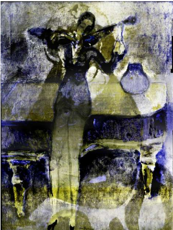
Analyse aux rayonnements Infra-rouge de l'œuvre de Kees Van Dongen, La Violoniste .

Sous La Violoniste , ce n'est donc pas seulement un portrait qui sommeille mais un aperçu unique de la créativité et des méthodes de travail de Van Dongen.