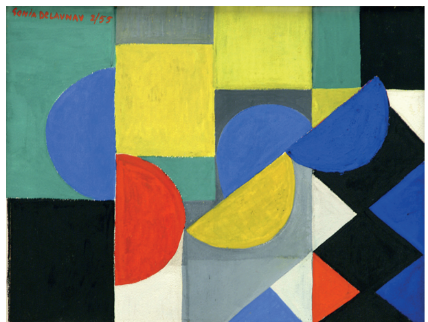
Sonia Delaunay, Composition n° 450, 1955.