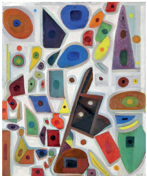
Henri Jean Closon, Les blancs sont des couleurs , 1946 © Musée des Beaux-Arts de Liège

Kunst is een krachtig middel om emoties uit te drukken en te kanaliseren. In tijden van omwenteling kan kunst als katalysator werken, een dialoog op gang brengen en diepe emoties oproepen. Abstracte kunst blijft zich ontwikkelen als een relevante vorm. Het potentieel ervan maakt het tot een essentiële pijler van de hedendaagse kunstscène.