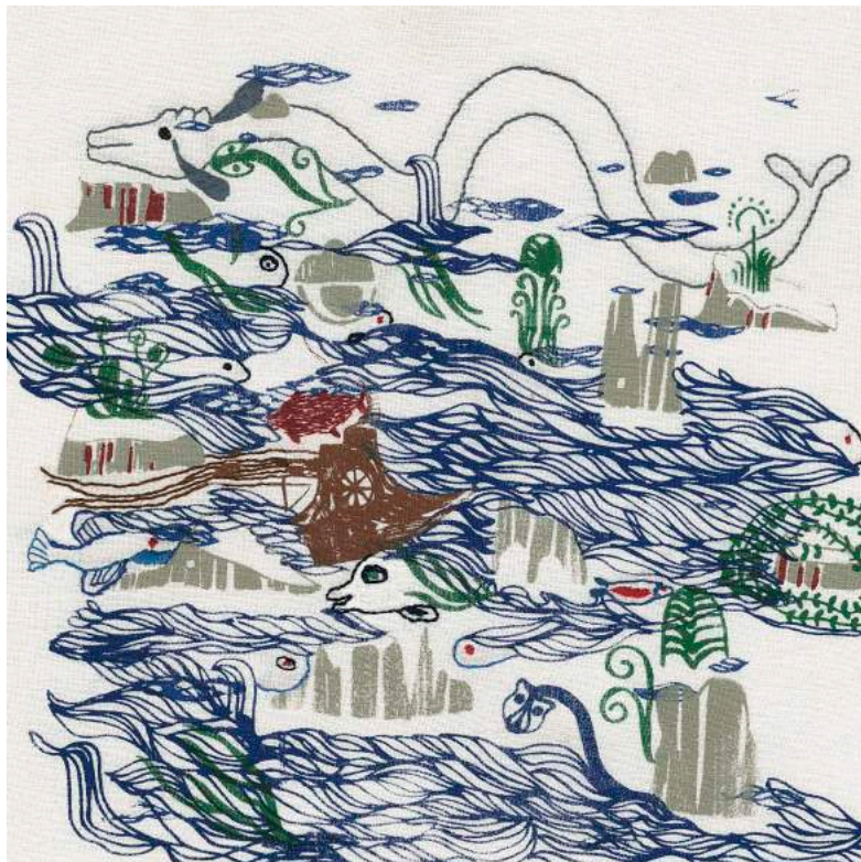
Ulysse et Pénélope , Sérigraphie et broderie sur draps anciens © Sandra Dufour © Éditions Thierry Magnier

Elle est actuellement en résidence aux ateliers RAVI à Liège avec un nouveau projet d'album : L'idée de Marnie . qui met en scène le fil de l'idée. Dans ce projet, texte et image textile correspondent et se lient. Le fil circule dans le texte, aux accents rythmiques, ponctué de rimes tels des motifs. L'image est, quant à elle, à l'économie de moyen. Fils aux couleurs réduites sur un coton blanc transparent constituent chaque page. Le fil, point après point, illustre le texte. Le lecteur attentif pourra en deviner le chemin. La transparence du tissu laissant apercevoir l'envers, le début et la fin de chaque fil.