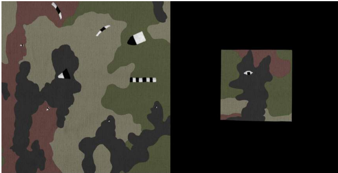
Larnes, 2004 © Louise Marie Cumont © Editions MEMO