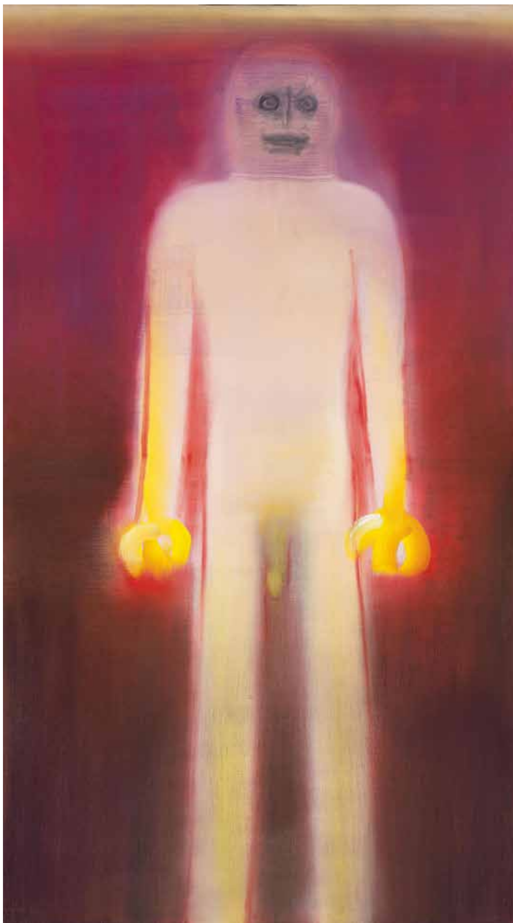
→ Miriam CAHN, Nach Diane Arbus , 2012, collection de la Province de Hainaut ©BPS22