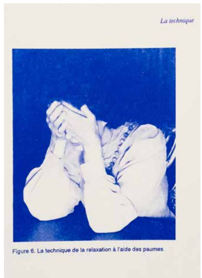
Figure 6. La technique de la relaxation à l'aide des paumes.