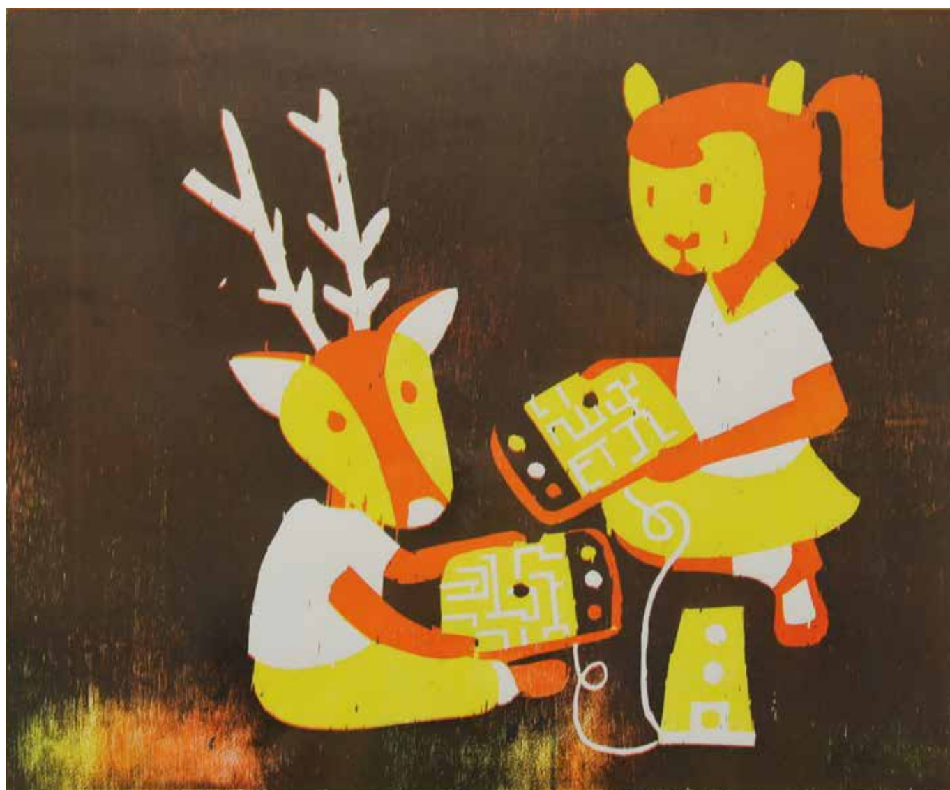
↑ Laurence Gony, Jeu avec l'enfant , 2006. Collection de la Province de Hainaut en dépôt au BPS22