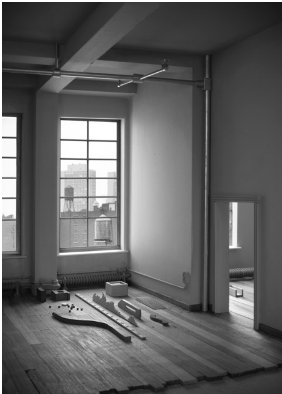
Philippe De Gobert, NY 2 378 , photographie 140x 110 cm