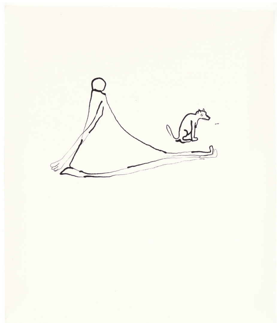
Anne-Marie Schneider, Sans titre , 2003, Encre sur papier, 33 x 38 cm, Collection Musée des Arts Contemporains au Grand-Hornu, propriété de la Fédération Wallonie-Bruxelles ©SABAM, Belgium