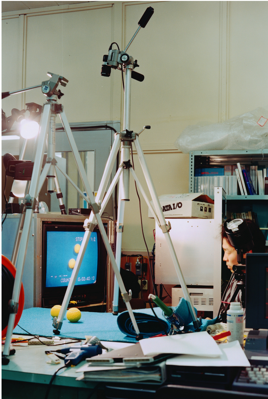
Lewis Baltz, Artificial Intelligence , Toshiba, Kawasaki City (JP), Diasac, éd. 10 + 2 AP, 144 x 108 cm, 1989-91. ©Successors of Lewis Baltz. Used by permission. Courtesy Galerie Thomas Zander, Cologne