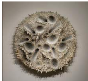
Aggregation 16 MA 027 Star 6 2016 Mixed media with Korean mulberry paper 200cm diameter