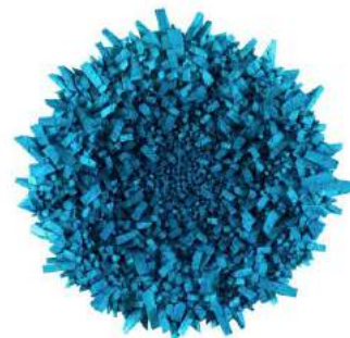
Aggregation 17MA023-Star5 2017 Mixed media with Korean mulberry paper 110cm diameter