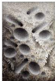
Aggregation16-SE080 2017 Mixed media with Korean mulberry paper