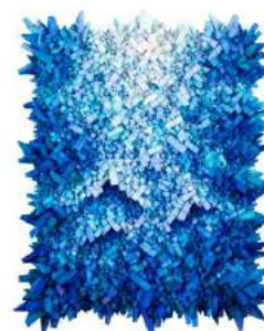
Aggregation17 2017 Mixed media with Korean mulberry paper 137x114