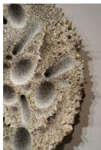
Aggregation 16 MA 027 star Detail 2016 Mixed media with Korean mulberry paper 200x200