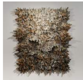
Aggregation 17 MA 020 2017 Mixed media with Korean mulberry paper 184x160cm