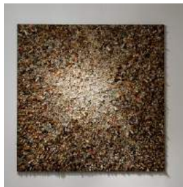
Aggregation 07 D126A 2017 Mixed media with Korean mulberry paper 200x200

Les visuels sont également disponibles en HR.