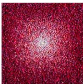
Aggregation16-JL060 2017 Mixed media with Korean mulberry paper