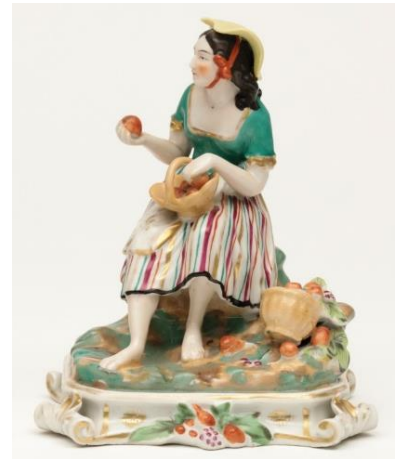
Van links naar rechts