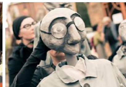
De g à d : Panhard - Levassor 1896 © Pol Sonet, La Compagnie des Bonimenteurs © Grapheur and co, Machine à voyager dans le temps © Thierry Braconnier/Antoine Jolivet, Grooms Service © La Compagnie Altitude 80, Imprimascrap © Gregory Gros, C(h)oeur de Marionnettes © Tchoumi,

Des animations ambulantes (tout âge) pour être bien accompagné : boniments avec La Compagnie des Bonimenteurs, orgue de barbarie de François Dupont, échassiers « Grooms Service », parade d'une trentaine de vélos par les Huy Grand Cycle, spectacle de marionnettes géantes «C(h)oeur grisés ».