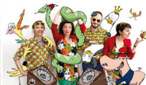
De g à d : Professeur Crazy bubbles © Patrick Harnett, Gravure sur gomme © Brock'N'Roll, Radio des Bois © WWF - Radio des Bois

Des animations Belle Époque (tout âge) pour vivre demain le temps passé : machine à voyager dans le temps, barbier « 50's Barber Shop », confiserie 1900, jeux d'époque, espace « écrivain public », démonstrations de danses d'époque avec Aliquam Amentis, spectacle « La course aux escargots », exposition de voitures oldies – Lorraine Dietrich, Panhard Levassor, Decauville, Renault ... –, démo d'impressions avec Imprimascrap (imprimeur typographe), démo d'artisanats avec le groupement Oude Volksambachten Nu.