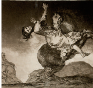
El caballo raptor 1815/19 ets/aquatint (Los Disparates).