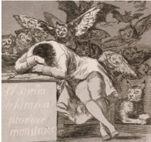
El sueño de la razón produce monstruos 1799 ets/aquatint (Los Caprichos).