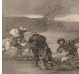
Otro modo de cazar a pie 1814/16 ets/aquatint (La Tauromaquia)