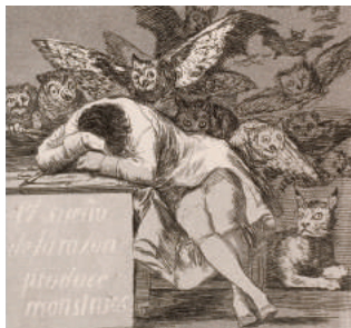
El sueño de la razón produce monstruos 1799 eau-forte/aquatinte (Los Caprichos).