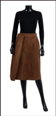
MAISON MARTIN MARGIELA (Automne-hiver 2000/01) Ligne Blanche, Jupe «Taille 78 » en daim marron estimation : 1 000 - 1 500 €