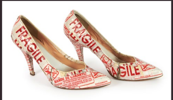
MAISON MARTIN MARGIELA (Printemps-été 2006) Escarpins recouverts d'adhésif « Fragile » appliqué à la main, estimation : 1 200 - 2 200 €