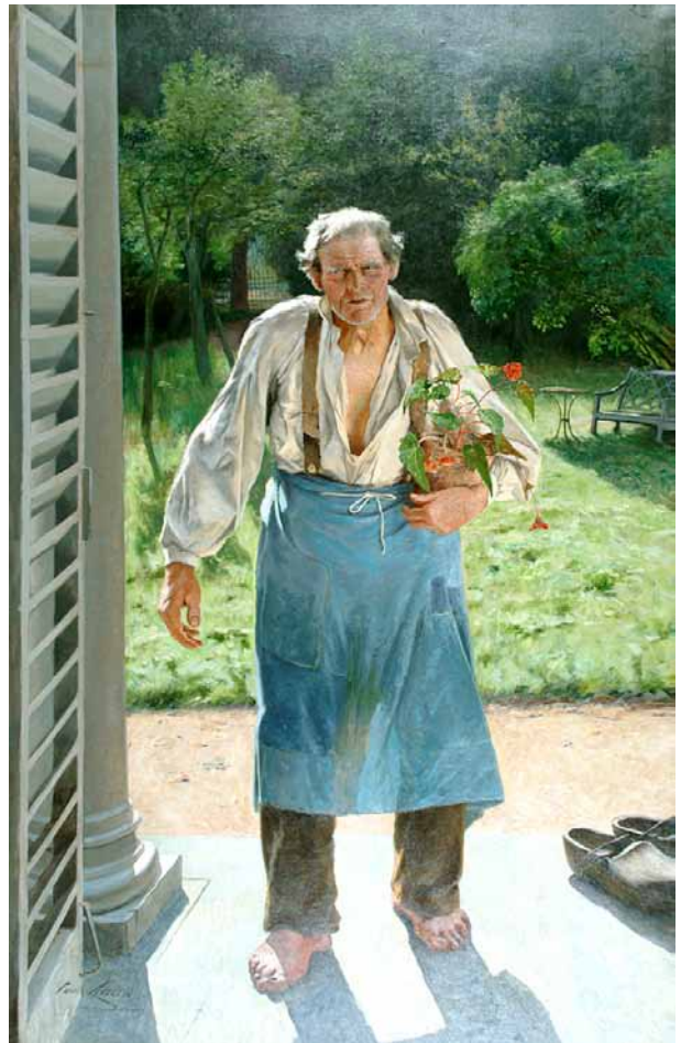
Emile Claus, Le vieux jardinier , vers 1886

De tentoonstelling Luik. Meesterwerken wil zo een dialoog opzetten tijdens verschillende tijdperken en stromingen, niet zonder de bezoeker een bijzondere focus voor te stellen, op sommige kunstenaars en artistieke stromingen: het lumineuze talent van Rik Wouters, variaties op het thema van het stilleven of ook nog een bijzondere aandacht voor Cobra en een evocatie van het ijzerbekken van Luik doorheen de blik van kunstenaars in de 20e en 21e eeuw.