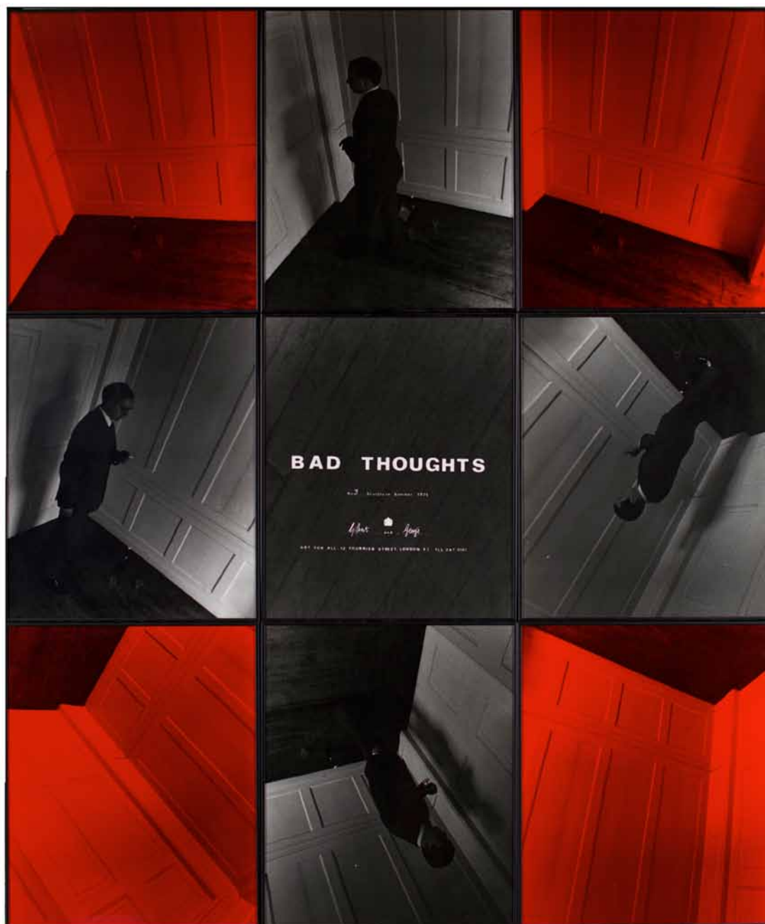
Gilbert and George, Bad Thoughts / N°3, 1975.

Ten slotte hebben we het doek Deux têtes (Twee hoofden) dat in 1909 door Picasso werd geschilderd, twee jaar na zijn baanbrekende werk Les Femmes d'Alger (O. J. 'De Jongedames van Avignon') , en slechts zes jaar na ons schilderij La famille Soler (De familie Soler) (1903) dat momenteel deel uitmaakt van de tentoonstelling Picasso, bleu et rose in het Musée d'Orsay in Parijs. Met dit werk heeft het museum een voorbeeld van het kubisme, een beweging die de kunstgeschiedenis aan het begin van de twintigste eeuw revolutioneerde», besluit de conservatrice.