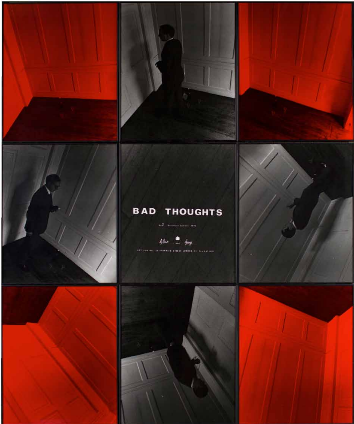
Gilbert and George, Bad Thoughts / N°3, 1975.

Enfin, la toile Deux têtes a été peinte par Picasso en 1909, soit deux ans après l'oeuvre-charnière Les Femmes d'Alger , et est postérieure seulement de six ans de notre tableau La famille Soler (1903), actuellement présenté dans l'exposition « Picasso, bleu et rose » au Musée d'Orsay à Paris. Cette oeuvre permet au musée d'évoquer le cubisme, mouvement qui a révolutionné l'histoire de l'art au début du XXe siècle », conclut la conservatrice.