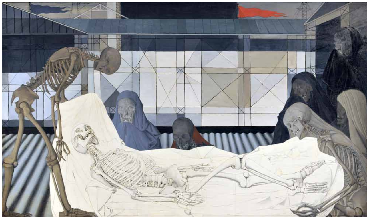
Paul Delvaux, La mise au tombeau , 1953. © Ville de Liège / Sabam 2018

Étonnamment, les quatre œuvres se situent dans une période très courte, de 1909 à 1915, témoins de l'intérêt du collectionneur pour des courants stylistiques d'avant-garde, émergents en ce début du XXe siècle: le cubisme, le futurisme, et le suprématisme russe. Les deux œuvres de Malevitch viennent combler une lacune importante au niveau des collections du musée : ce peintre majeur y était jusqu'ici totalement absent.