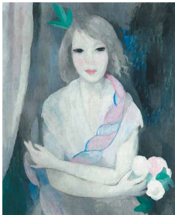
Marie Laurencin, Portrait de jeune fille , 1924 © Ville de Liège / Sabam 2018