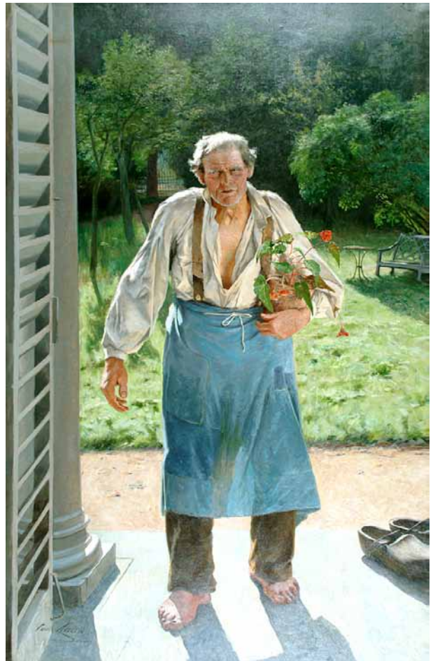
Emile Claus, Le vieux jardinier, vers 1886

L'exposition Liège. Chefs-d'œuvre entend ainsi établir un dialogue entre les époques et les mouvements formels , non sans proposer aux visiteurs quelques coups de projecteur particuliers, sur certains artistes et courants artistiques : Auguste Donnay paysagiste, Rik Wouters au talent lumineux, James Ensor l'insaisissable, Pol Bury et ses sculptures mobiles, le mouvement Cobra, en passant par une évocation de la sidérurgie du bassin liégeois à travers les regards d'artistes des 20ème et 21ème siècles. Certaines pièces maîtresses sortent exceptionnellement de leur écrin : Les Femmes vertueuses de Lambert Lombard, une statue et des bozzetti du sculpteur baroque Jean Del Cour, l'énigmatique Mise au tombeau de Paul Delvaux, ainsi qu'un nombre important d'œuvres de la Fédération Wallonie-Bruxelles sont remises à l'honneur.