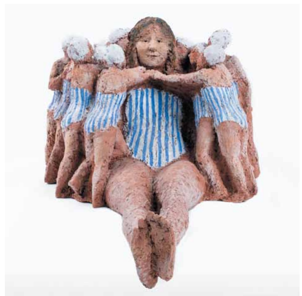
Mady Andrien, Mes chères baigneuses , 2016 © Musée des Beaux-Arts de Liège

L'exposition s'organise sous la forme d'une rétrospective thématique, autour d'une septantaine de sculptures, en terre ou en métal, enrichie de quelques collages et fusains, présentant plus de cinquante années de création.