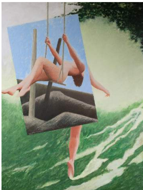
La Vie en tant que hiéroglyphe, 2014-2017 (178 x 134 cm)