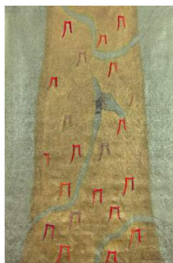
Vénéneuse (Métamorphose) , 2014, 63 x 26 cm