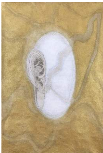
Enchantée , 2011, 214 x 150 cm