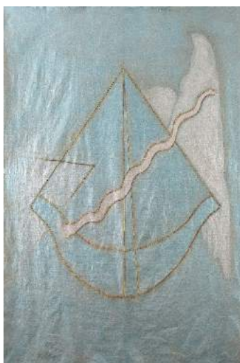
Grande Musique de l'Espace , 2016, 212 x 140 cm

La plupart des œuvres présentées aujourd'hui, une soixantaine, n'ont jamais été exposées et appartiennent encore à l'artiste. Elles sont presque toutes postérieures à 2011, beaucoup de peintures en grands formats, proposées par thématique, mais aussi des broderies mêlées à la peinture, une vidéo et des petites sculptures plus anciennes.