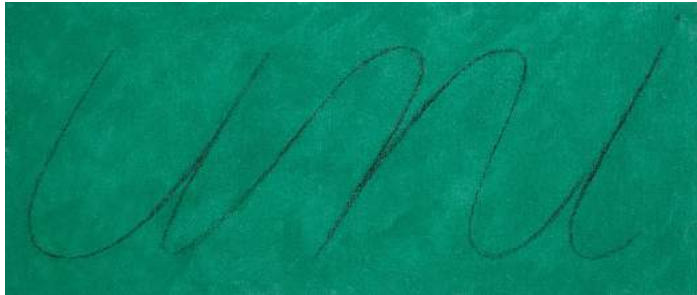
Rébus Univers , 2014 (47 x 113 cm)

constructions, des écritures et des séries de peinture. Car la série est aussi une façon d'exprimer davantage les facettes de ses rencontres , d'ajouter une dimension temporelle, de déployer le temps en utilisant l'espace, de développer la pensée à travers la matière et la forme. Tout ne se résume pas en un, mais s'étire, se déploie, s'exprime, se narre.